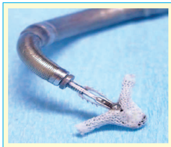
Rycina 2. System wprowadzający z implantem MitraClip (Abbott)

System MitraClip składa się z implantu (ryc. 2), cewnika wprowadzającego oraz systemu wprowadzania implantu, który pozwala na umieszczenie go na płatkach zastawki mitralnej, powodując ich permanentne zbliżenie, czego rezultatem jest powstanie dwuujściowej zastawki mitralnej. Implant jest zamocowany do dystalnej części systemu wprowadzającego. W celu dojścia do lewego przedsionka wykorzystuje się standardową procedurę nakłucia przegrody międzyprzedsionkowej, przeprowadzaną