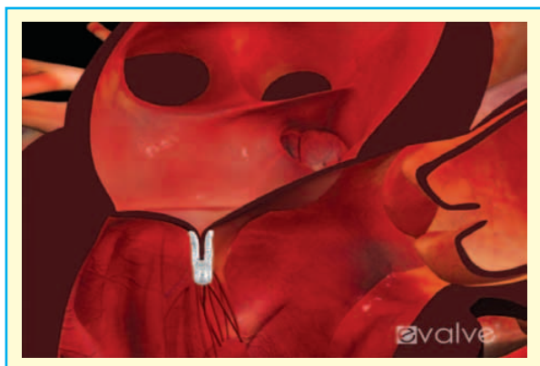
Rycina 4. Uwolniony implant łączący płatki zastawki mitralnej

W sytuacji gdy redukcja fali zwrotnej nie jest wystarczająca przy użyciu jednego implantu, można zastosować drugi bądź nawet trzeci w celu osiągnięcia zadowalającego wyniku. W takim przypadku echokardiografista ocenia, czy efektywna powierzchnia zastawki jest wystarczająca na uwolnienie kolejnego implantu bez ryzyka powstania stenozы mitralnej. W razie niepowodzenia zabiegu, a także wystąpienia powikłań w większości przypadków możliwe jest przeprowadzenie operacyjnego zabiegu naprawy zastawki [50–52]. Leczenie farmakologiczne po zabiegu obejmuje podawanie kwasu acetylosalicylowego w dawce 100 mg/d. przez 3 miesiące (wg niektórych autorów do końca życia) oraz kłopidogrelu w dawce 75 mg/d. przez 1–3 miesiące (bez dawki nasycającej). Pacjentom, którzy wymagają przewlekłej antykoagulacji, na przykład z powodu przewlekłego migotania przedsionków, podaje się kwas acetylosalicylowy i lek z grupy antagonistów witaminy K. Czas hospitalizacji po niepowikłanym zabiegu wynosi zwykle 2–3 dni. Wadą metody przezskórnej jest brak możliwości wykonania anuloplastyki w trakcie jednej procedury [44].