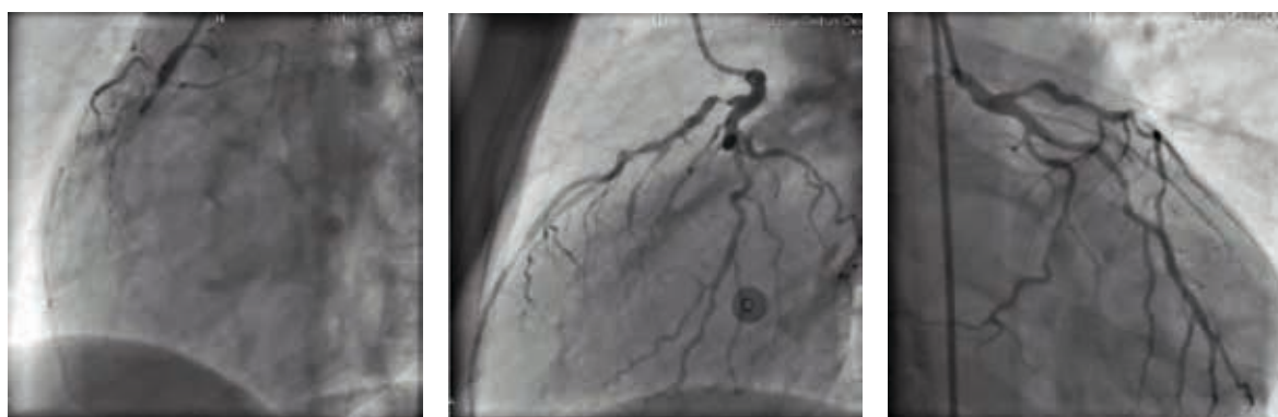
Rycina 2. Angiografia tętnic wieńcowych wykonana podczas hospitalizacji w klinice: amputowana prawa tętnica wieńcowa, krytyczne i istotne zwężenia w gałęzi międzykomorowej przedniej lewej tętnicy wieńcowej oraz istotne zwężenie gałęzi brzeżnej pierwszej

OB — odczyn Biernackiego; INR ( international normalized ratio ) — znormalizowany wskaźnik międzynarodowy; APTT ( activated partial thromboplastin time ) — czas kaolinowo-kefalinowy; AspAT ( aspartate aminotransferase ) — aminotransferaza asparaginowa; AIAT ( alanine aminotransferase ) — aminotransferaza alaninowa; cTnT ( cardiac Troponin T ) — troponina T; GFR ( glomerular filtration rate ) — wskaźnik filtracji kłębuszkowej; CRP ( C-reactive protein ) — białko C-reaktywne