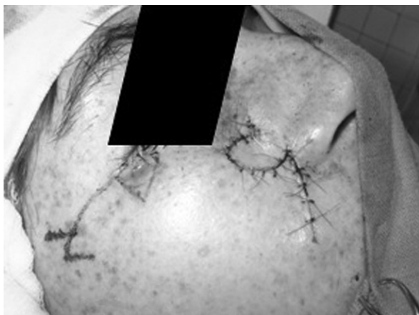
Rycina 3. Usunięcie zmiany skóry policzka prawego