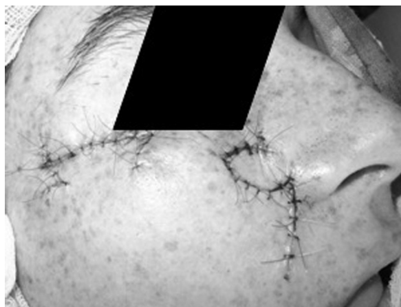
Rycina 4. II etap operacji — wycięcie zmiany powieki dolnej