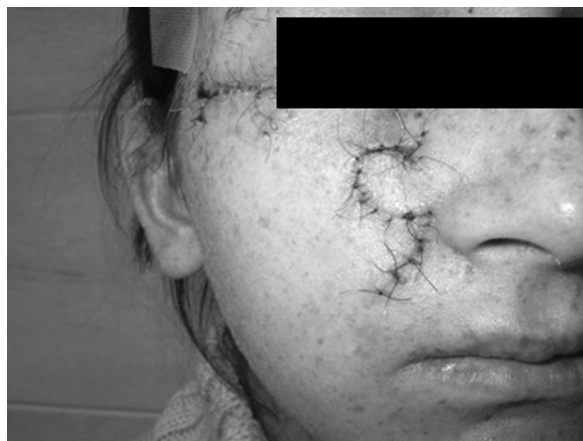
Rycina 5. Kilka dni po operacji — uzyskano dobry efekt kosmetyczny

onkologiem zdecydowano o chirurgicznym usunięciu zmiany. W znieczuleniu ogólnym dotchawiczym wykonano zabieg, polegający na wycięciu dwóch zmian chorobowych: jednej na części bocznej prawej dolnej powieki i drugiej położonej nieopodal na prawym policzku. Powstałe ubytki pokryto uszypułowanym płatem skórny z prawego policzka (ryc. 3, 4). Wycięty preparat przesłano do rutynowego badania histopatologicznego, które wykazało w obu przypadkach obecność tkanki raka podstawnokomórkowego ( carcinoma basocellulare ). Oba ogniska raka usunięto w całości. Gojenie rany przebiegało bez powikłań, uzyskano zadowalający efekt kosmetyczny (ryc. 5). Chora pozostaje pod opieką dermatologa i chirurga onkologicznego. Nie zaobserwowano dotychczas wznowy ani pojawienia się nowych ognisk nowotworzenia w obrębie skóry. Pomimo tego konieczne są regularne kontrole i odpowiednia pielęgnacja skóry, połączone z maksymalnym ograniczeniem ekspozycji na promieniowanie ultrafioletowe.