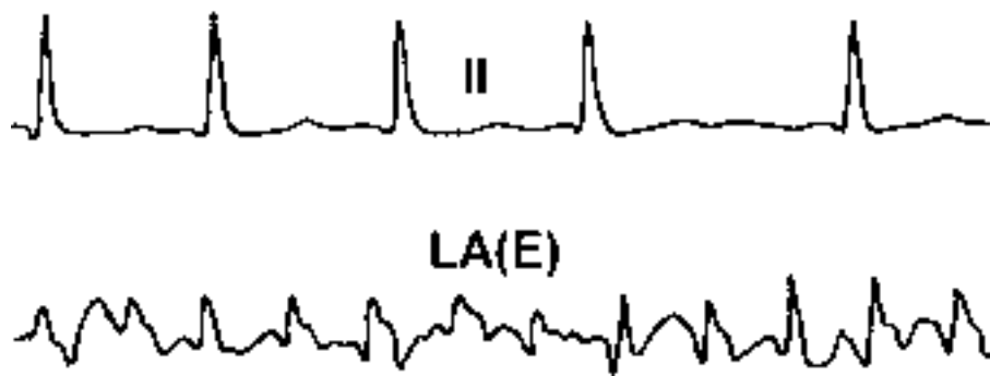
Ryc. 2. Układ odprowadzeń zapisu jak na rycinie 1. Zapis przelykowy przedstawia typ II migotania przedsionków, określany przez dające się wyodrębnić załamki P o różnej morfologii z oscylacjami pomiędzy nimi.