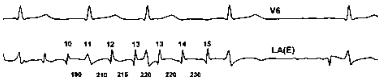
Ryc. 5. Zapis momentu samoistnego ustąpienia migotania przedsionków poprzedzony przejściem w bardziej zorganizowaną postać migotania przedsionków (wzrost amplitudy P, wydłużenie cyklu, pojawienie się wyraźnej linii izoelektrycznej pomiędzy załawkami P). Szybkość zapisu 50 mm/s.