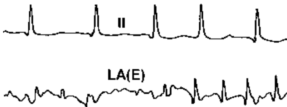
Ryc. 4. Układ odprowadzeń zapisu jak na rycinie 1. Zapis przełykowy przedstawia typ IV migotania przedsionków, stanowiący połączenie typu I i III migotania przedsionków. W pierwszej części bezładne wychylenia przechodzące w wyraźnie wyodrębnione załamki P, z linią izoelektryczną pomiędzy nimi.