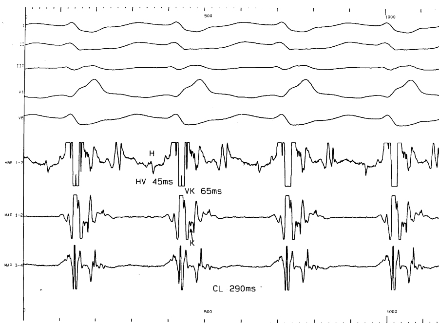
Ryc. 2. W czasie częstoskurczu przedsionkowo-komorowego ortodromowego (cykl 290 ms), z cechami bloku zupełnego prawej odnogi pęczka Hisa (QRS 140 ms), lokalna aktywacja lewego przedsionka wyprzedza aktywację prawej komory. Aktywacja lewego przedsionka poprzedza sygnał pęczka Kenta (K) w 65 ms. Aktywacja lewego przedsionka i przyprzegrodowej części prawego przedsionka poprzedza zakończenie aktywacji prawej komory (MAP i HBE).

Fig. 2. During orthodromic atrioventricular tachycardia (CL 290 ms) with right bundle branch block (QRS 140 ms) local activation of left atrium is earlier than the activation of the right ventricle. Signal of Kent bundle is seen. 65 ms after onset of left ventricle activation. Activation of the left atrium and region of the atrial septum was complete before ending of the right ventricle activation.