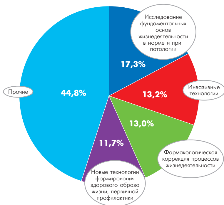
Рис. 2. Структура объемов ассигнований федерального бюджета на реализацию в 2013 г. программы фундаментальных медицинских научных исследований по направлениям согласно распоряжению Правительства Российской Федерации от 3 декабря 2012 г. № 2237-р

ская академия медицинских наук реорганизована путём присоединения к РАН, а организации, находившиеся в её ведении, переданы в ФАНО России.