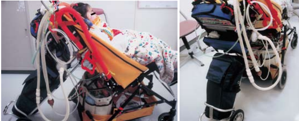
図2 在宅人工呼吸器 (LTV950) を装着し外来通院中の女児 実際の外来通院では、ポータブル人工呼吸器以外にも、携帯用酸素ボンベ、バッテリー、吸引吸入機、ジャクソンリリース、予備のカニューレ、サクシオンチューブ他様々な物品を常時携帯する必要がある。重度障害児の在宅管理においては、一般的な障害児介護以外に、これら医療機器の取り扱いについても介護者に習得いただくことが必須である。