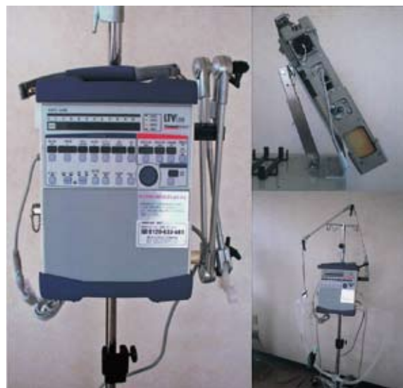
図1 フジ・レスピロニクス社製LTV1200ポータブルICUベンチレーター（左：正面、右上：右側面、右下：セットアップ）

幾度かの入院を繰り返しながらではあるが、2年間以上の在宅を中心とした管理が可能であった症例が、10例中5例と全体の50%を占めていた。