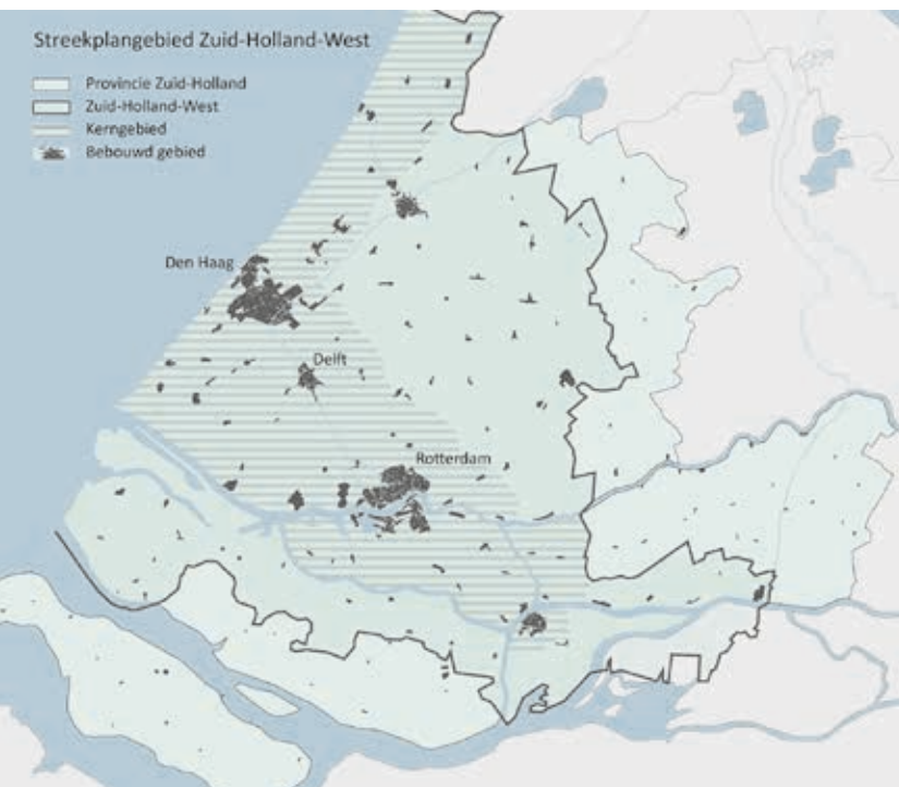
4. Kaart provincie Zuid-Holland met het gewestelijk plangebied Zuid-Holland-West. Op basis van de kaart van Th.K. van Lohuizen uit 1929, opgesteld voor de tentoonstelling 'Gewestelijk plan Zuid-Holland-West' (bewerking auteur, 2015)

In 1919 adviseerde Bakker Schut, namens het Instituut, de regering om de bepalingen over het uitbreidingsplan te versoepelen en aan te passen. 'Een grote stad', zo schreef hij, 'is een snel levend organisme met steeds wisselende behoeften. Het uitbreidingsplan zal met die behoeften moeten groeien en veranderen. Het zal zich moeten aanpassen aan de zich wijzigende esthetische inzichten en aan de nieuwe eisen van de techniek. Aan een uitbreidingsplan mag niet doctrinair worden vastgehouden, omdat het eenmaal zo is vastgesteld; het wordt dan een knellend keurslijf, dat de gezonde ontwikkeling tegenhoudt.' 21 In 1921 besloot de regering de stedenbouwkundige paragrafen in de Woningwet te wijzigen. Datzelfde jaar werd door het Instituut een Commissie voor Stedebouw ingesteld, met Granpré Molière als voorzitter. Twee jaar later werd deze commissie omgevormd tot een volwaardige afdeling en de naam van het Instituut werd gewijzigd in Nederlands Instituut voor Volkshuisvesting en Stedebouw (NIVS). Stedenbouw werd sindsdien gezien als een zelfstandige discipline, maar had qua professionalisering en verwetenschappelijking nog een lange weg te gaan.