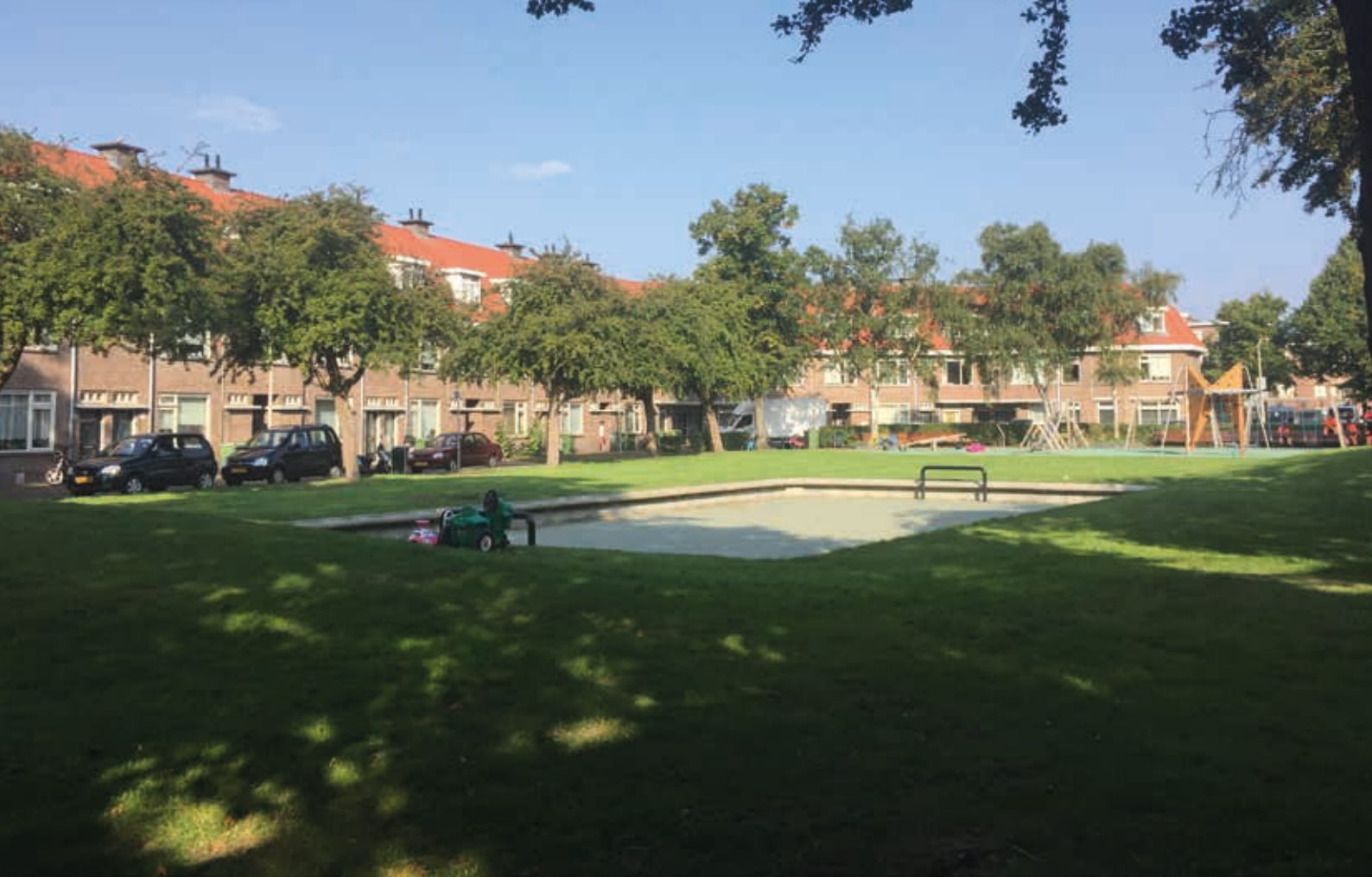
9b. Moerbeiplein (Vruchtenbuurt) in Den Haag in 2017. Veel stadsuitbreidingswijken die onder leiding van Bakker Schut werden gerealiseerd, zijn tegenwoordig geliefde woonwijken

Halverwege de jaren dertig was het einde van Bakker Schuts' loopbaan nog niet in zicht, maar de grote uitbreidingen waren achter de rug en er werden in vergelijking tot de voorgaande jaren nauwelijks meer gemeentelijke woningen gerealiseerd; tussen 1934 en 1940 bouwde de gemeente en woningbouwverenigingen slechts 2 procent van de in totaal bijna 7.000 woningen. 34 Berlage werd in 1934 opgevolgd door de architect en stedenbouwkundige W.M. Dudok (1884-1974). Deze kreeg de taak uitbreidingsplannen te maken voor Den Haag Zuid-West, maar voor de Tweede Wereldoorlog kwam er weinig van de plannen terecht. Bakker Schut begon ondertussen langzaam afscheid te nemen van de dienst; in 1939 publiceerde hij een gedenkboek over de volkshuisvesting in Den Haag, waarin hij in 240 pagina's terugblik op de betekenis van de overheidsbemoeienis met de volkshuisvesting tussen 1914 en 1939. 35