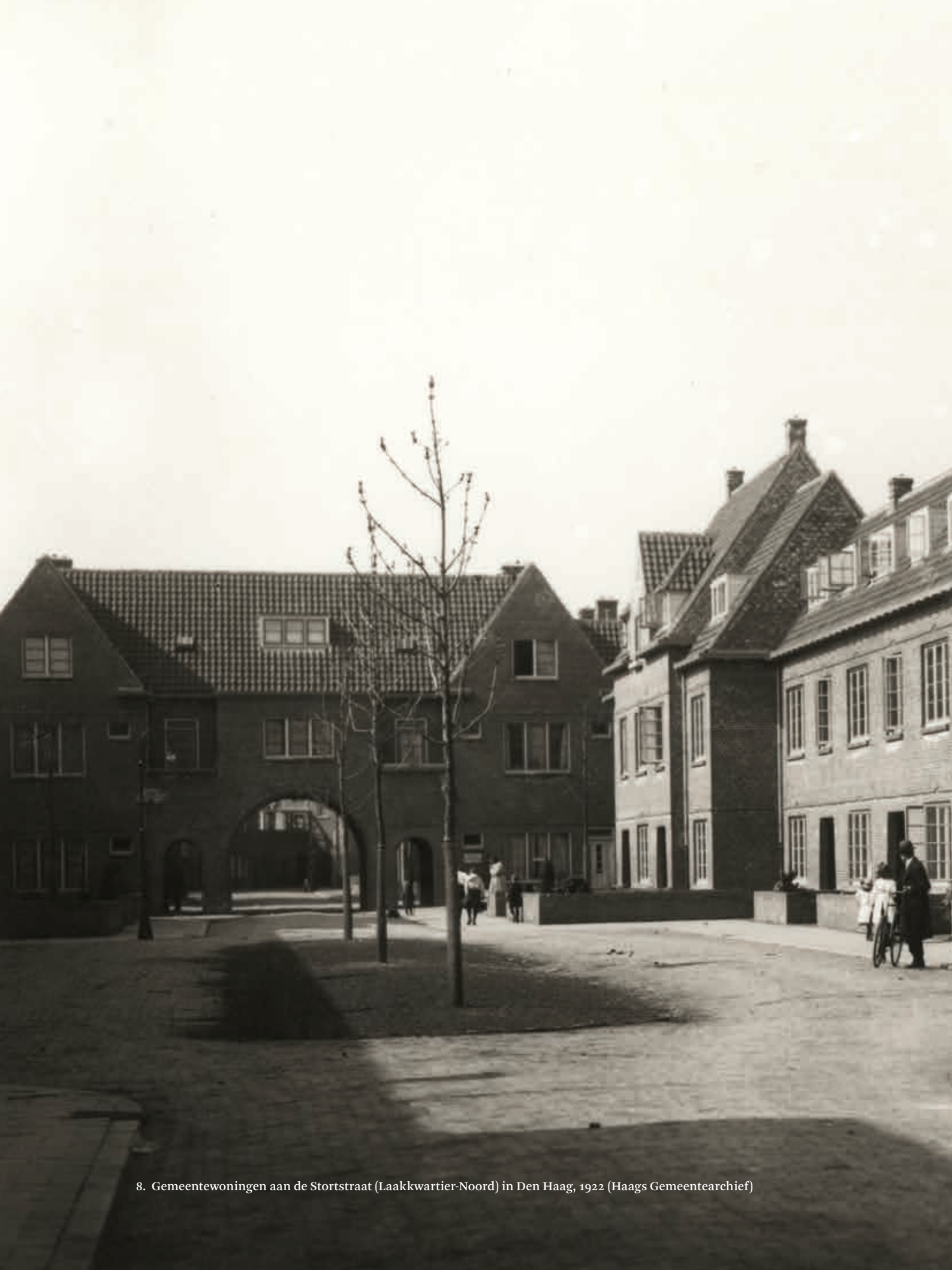
8. Gemeentewoningen aan de Stortstraat (Laakkwartier-Noord) in Den Haag, 1922 (Haags Gemeentearchief)