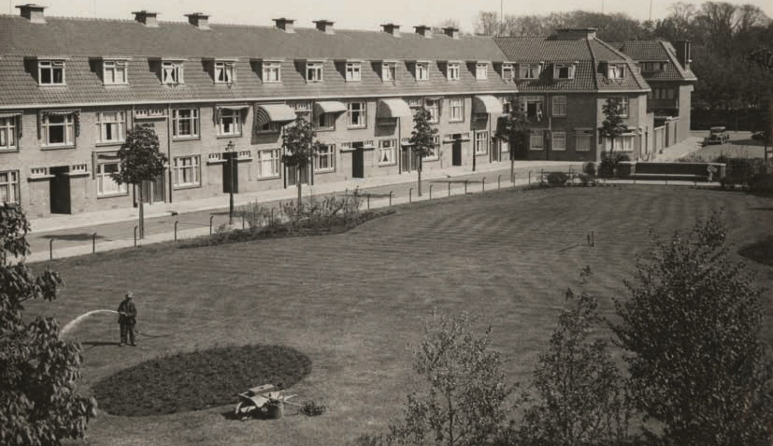
9a. Verenigingswoningen van de Algemeene Coöperatieve Woningvereniging, aan de Moerbeiplein (Vruchtenbuurt) in Den Haag, 1935

meer dan 12.000 woningwetwoningen gerealiseerd; dit was ruim 40 procent van het totaal aantal gebouwde woningen. 32 Bij de stadsuitbreiding werd op hoofdlijnen het Algemeen Uitbreidingsplan (1908) van Berlage gevolgd. In het begin werden er vooral kleine sociale wijkjes gebouwd, zoals Duindorp, Laakkwartier-Noord en Spoorwijk (afb. 8). Later volgden ruimer opgezette middenstandswijken met veel groen, zoals de Vruchten- en Heesterbuurt. In deze monumentale wijken met (bruine) bakstenen bouwblokken en intieme woonpleinen werden de idealen die de SDAP koesterde over de gelijkwaardigheid en gemeenschappelijkheid van alle burgers in de samenleving verwezenlijkt (afb. 9a en b).