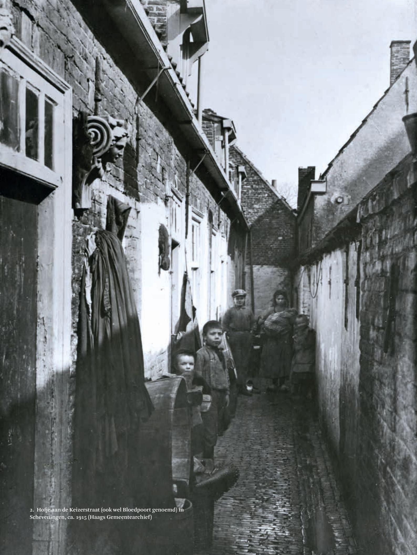
2. Hofje aan de Keizerstraat (ook wel Bloedpoort genoemd) in Scheveningen, ca. 1915