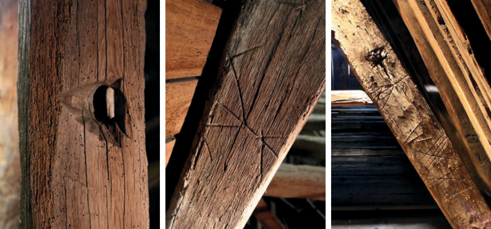
7. A Een volledig intacte vlotverbinding; B Een handels- of eigendomsmerk. Beide foto's zijn afkomstig uit de dakkap van het schip van de parochiekerk van Mariakerke nabij Gent (1278-1288 (d)); C Complexe handelsmerken uit de kap van het stadhuis van Brugge (1365-1387 (d))

van dergelijke bomen werden bijvoorbeeld gebruikt als de centrale stijl (in Vlaanderen: de staak, in Nederland: de standerd) in een standerdmolen (in Vlaanderen: staakmolen), waar de standerd samen met de steenbalk het gewicht van de kast moet dragen. De dichtheid (aantal exemplaren per ha) van dergelijke 'overstaanders' was echter laag, waardoor de hoeveelheid aan grote stukken bouwhout die uit een middel-