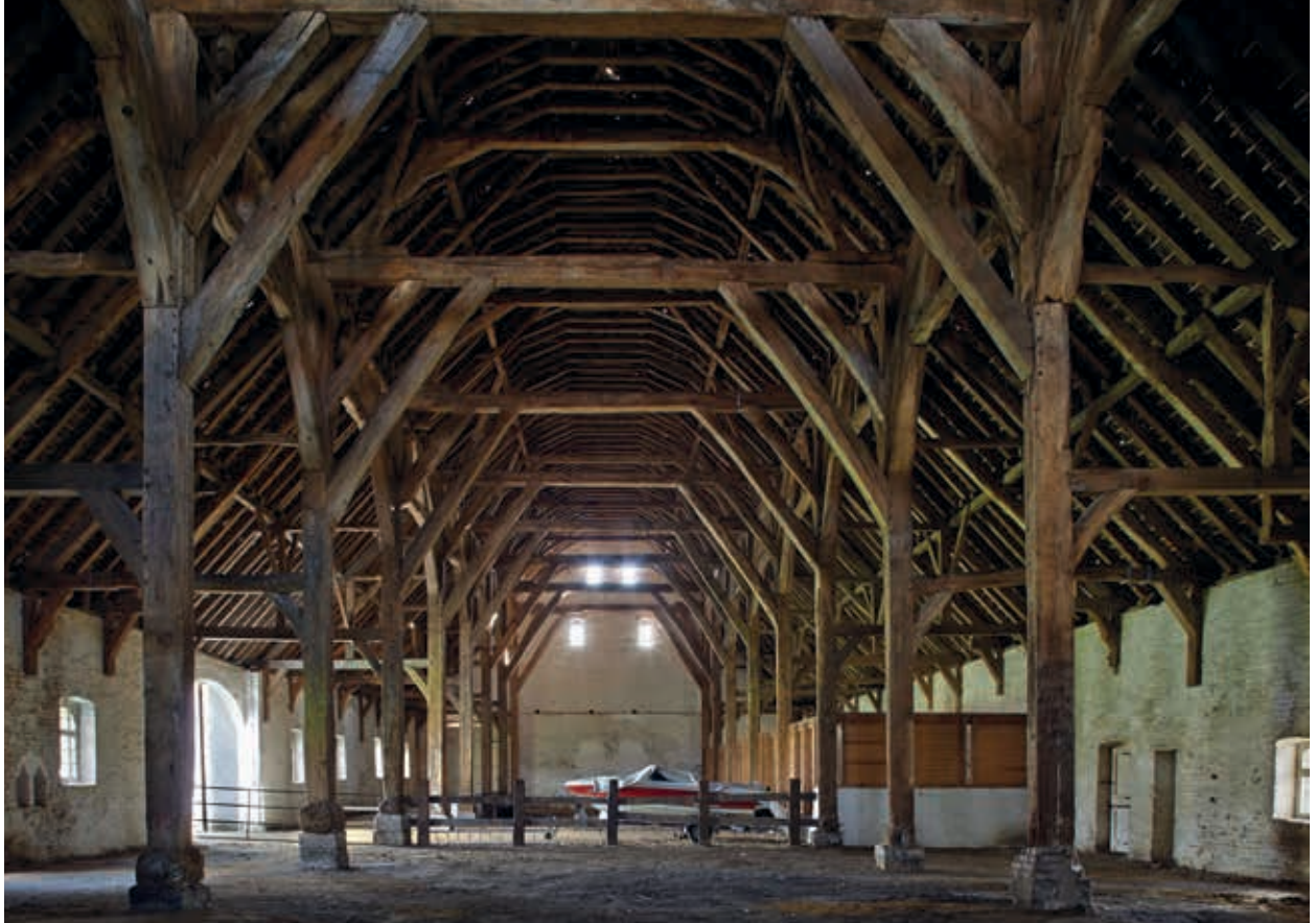
4. De gotische abdijshuur van Ter Doest. Het gebint dateert uit het eind van de veertiende eeuw