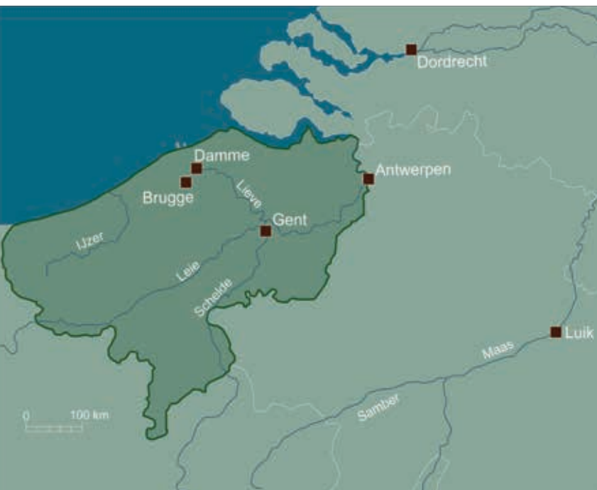
2. De grenzen van het graafschap Vlaanderen

uit de kapconstructie van de kerk in Belsele wijzen er inderdaad op dat het eikenhout uit een dicht, gesloten bos werd gehaald. Dat valt af te leiden uit de vrij regelmatige breedte van de individuele groeiringen. Immers, in gesloten bossen groeien eiken relatief langzaam uit tot dominante bomen. Over het algemeen zijn de jaarringen van zo'n dominante eik dan ook vrij smal en regelmatig van breedte. Ook zijn er relatief weinig plotselinge veranderingen op te merken in groeisnelheid. Dit zijn kenmerkende eigenschappen voor bomen uit een gesloten, natuurlijk bos. In de vijftiende eeuw werd de kerk verder uitgebreid met een transept en een nieuw koor. Opvallend is dat voor deze dakkappen eikenhout werd gebruikt dat duidelijk uit een ander type bos werd gehaald. De groeiringen op het hout zijn namelijk veel breder, wat wijst op een snellere groei, en vertonen ook veel meer variatie in hun breedte. Dit wijst op een meer open bosstructuur met een andere, wisselende dynamiek. Misschien zijn dit wel eiken uit een bos waar de menselijke invloed, door ontginningen en begrazing door vee, de over-