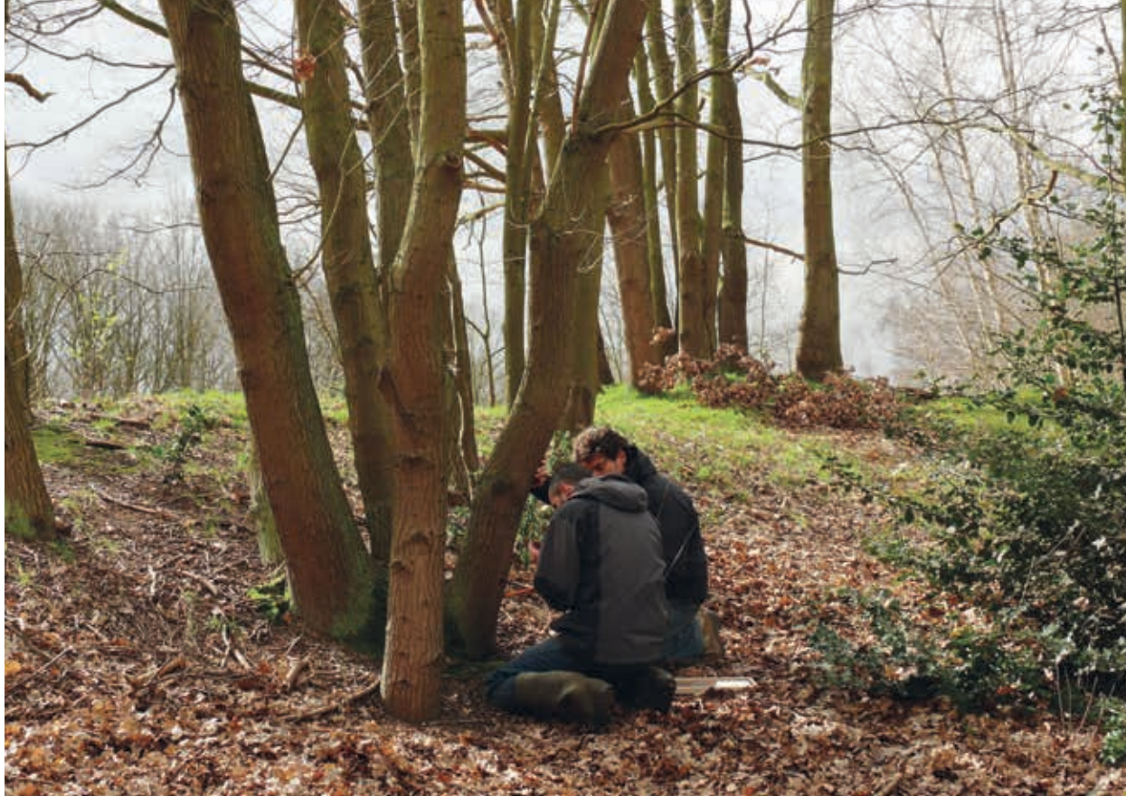
6. Hakhout in het Warandebos in Wetteren

plexen waren eigendom van de graaf van Vlaanderen waar hij het exclusieve jachtrecht had: de 'foreesten'. Deze waren niet toegankelijk voor de gewone burgers, en zeker niet om er op grote schaal hout te oogsten. Zowel bij grote werken aan het stadhuis van Gent 7 en Brugge (aangetoond via dendrochronologisch onderzoek) werd hout uit het Vlaamse binnenland aangevoerd. De eigenaars van de beboste gebieden waren de grootgrondbezitters uit die tijd: abdijen, kerken, kloosters en de hoge adel. De toestemming om bomen te kappen in de tot hun eigendom behorende bossen was een voorrecht dat enkel werd verleend bij grote bouwprojecten.