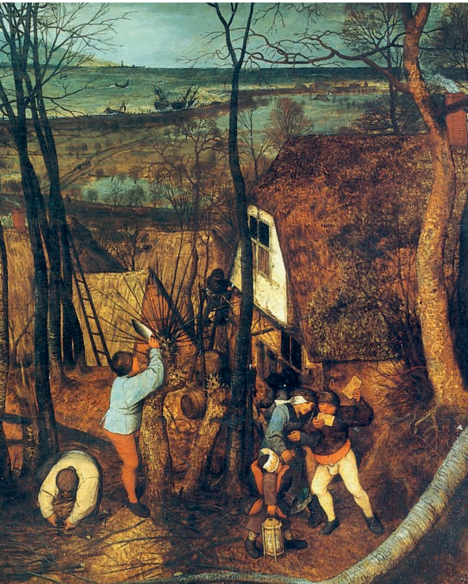
3. Detail uit De sombere dag van Pieter Brueghel de Oude (Kunsthistorisches Museum, Wenen)