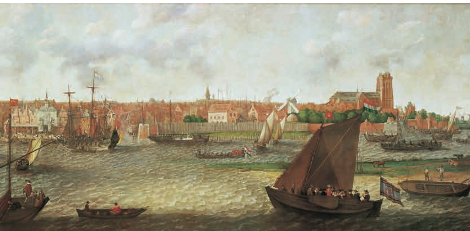
8. Gezicht op Dordrecht van Adam Willaerts uit 1629 (Dordrechts Museum). Links onderaan is een houtvlot afgebeeld

Opmerkelijk is dat deze vlotverbindingen dikwijls nog volledig zijn. Dit wijst er op dat het hout eerst werd verzaagd of gekantrecht tot balken, en daarna pas werd samengebonden om een vlot te bouwen. De aanvoer van eikenhout naar de Vlaamse steden gebeurde in de Middeleeuwen dus niet als rondhout (op stam),