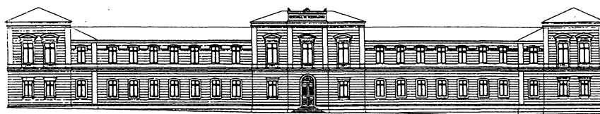
Fig. 1: Alzado do edificio para Escola de Veterinaria. Fonte: Gaceta de Galicia , 25.03.1903.

O Concello rematou por solicitar un novo destiño para o edificio e compensar quizais a doación dos terreos que fixera e como por aquel entón se estaban a crear novos Corpos de Artillería solicitouse un para Santiago. Este foi concedido de seguido, aloxándose na antiga Escola de Veterinaria e no mesmo ano 1924 o Reximento de Artillería da Campaña nº 28 e o Edificio pasou así a pertencer ó Estado e funcionou como Cuartel militar ata 1988, ano no que pasou a ser a Sede do Parlamento de Galicia 26 , chegando ata hoxe.