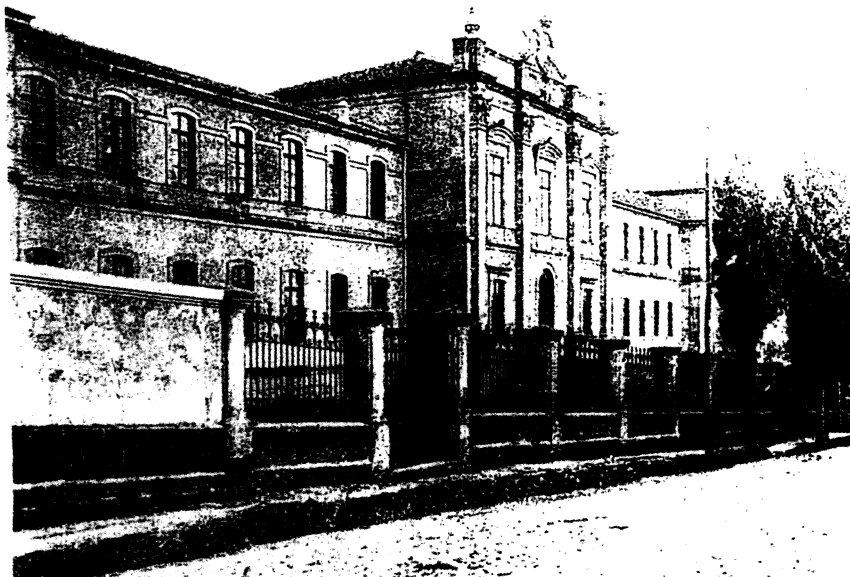
Fig. 3: A Escola de Veterinaria. 1903 Ca.

«CUADERNOS DE ESTUDIOS GALLEGOS», Tomo XLIX, Fascículo 115, Santiago 2002.