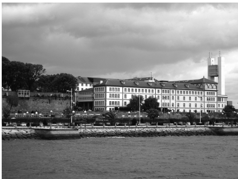
El antiguo Hospital Militar, hoy Hospital Abente y Lago.