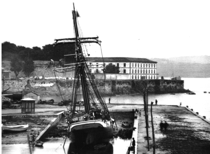
El Hospital Militar de Coruña a principios del siglo XX.