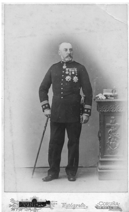
Ezequiel Abente y Lago, Subinspector médico de 1ª clase (Coronel). ARAG.

Superada la crisis humanitaria continuará en Coruña al frente del hospital, hasta que en 1901 es ascendido al empleo de Inspector médico de segunda clase y destinado como tal en la 3ª (enero), 6ª (febrero) y 8ª Región militar (1902), las dos últimas con capitánía general o sede en la ciudad de Coruña. Suprimida esta última región militar en 1904, con motivo de la reorganización del ejército, Ezequiel quedó en situación de cuartel hasta 1905. En abril de dicho año, siendo ya el primero de su escala, fue ascendido y nombrado Inspector médico de primera clase (brigadier o general de brigada) del IV Cuerpo del Ejército y, poco después, del I Cuerpo con mando y cuartel en Madrid. La relevancia y prestigio que implicaba su rango y empleo se acrecienta y refrenda, poco después, con el nombramiento como vocal del Real Consejo de Sanidad.