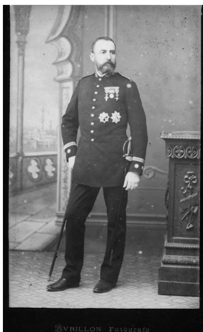
Ezequiel Abente y Lago, Subinspector médico de 2ª clase (Teniente coronel). ARAG.

Operaciones del Gobernador de Vizcaya, en Bilbao, desde el mes de marzo hasta julio. De allí pasa al Regimiento de Infantería de Almansa que, operando en el centro, interviene en la acción de Palomar el 14 de septiembre. En el verano de 1874, otra vez con el Ejército del Norte y formando parte del Regimiento de Caballería de Talavera, participa en los combates de Estella (Navarra) del 25 al 28 de junio y de Oteiza (Navarra) el 11 de agosto. Después es destinado al Regimiento de Ingenieros en Miranda del Ebro (Burgos), con el que asiste al socorro del sitio de Irún (Guipúzcoa) entre el 10 y 12 de noviembre. Por estos hechos de armas, a finales de ese mes, fue premiado otra vez con el grado de Subinspector médico de segunda clase (teniente coronel) que ahora sí ostentó durante años sin permutar. En la segunda mitad del siglo XIX y a consecuencia de las constantes guerras, era frecuente casos como el de Ezequiel en el Cuerpo de Sanidad, donde a los pocos años de servicio casi todos ostentaban, a título honorífico, uno o dos grados superiores al empleo que les correspondía por antigüedad 8 . Ya de vuelta en Miranda del Ebro se encargó del hospital allí montado hasta que, en el mes de abril de 1875, fue destinado al 4º Regimiento de Artillería a Pie, con plaza en A Coruña.