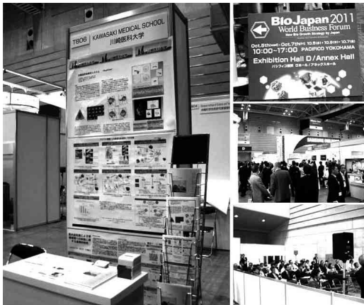
図5 2011年のBioJapan 2011での川崎医科大学出展のブース(左)、パシフィコ横浜入り口の掲示(右上)、会場の様子(右中)および口頭発表の様子(右下)。

ースでのポスター発表とともに、出展者の口頭での発表時間も用意され（今回、本学では口頭は実施しなかったが）ていた。また、比較的強く感じたのが、科学技術振興機構（Japan Society of Technology Agency, JST）が非常に積極的に参加していたことであった。JSTによる産学連携プログラムの口頭発表だけで、1発表エリアを終日占めるといった感じであり、あるいは実際の産官学連携でのイノベーション創生に向けては、BioJapanが有用なのかも知れないとも感じられる部分もあった。しかし、ある意味、いわゆる学会参加ではないので目的意識をしっかりと持って参加することが肝要であろうと思われた。