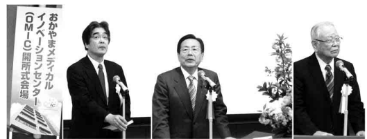
図2 岡山大学医学部での、「おかやまメディカルイノベーションセンター(OMIC)」の開所式(2011年4月27日)。左から看板、挨拶をされる岡山大学 森田潔学長、祝辞を述べられる岡山県 石井正弘知事および同じく岡山経済団体連絡協議会 中島博座長。

特に「メディカルテクノおかやま」では、今年度より「おかやまメディカルイノベーションセンター(OMIC)」 17) 事業の実質的な管理運営の役割を担うことになった。OMIC事業(開所式の様子を図2に示す)は、『岡山大学医療系キャンパス内に立地する利点を最大限に活かし、優れた医療研究シーズ、県内ものづくり企業群の技術と近未来の医療イノベーションを実現する分子イメージング技術を融合させ、産学官連携による医療先進県に相応しい岡山ならではの医療産業の創成と産業クラスターの実現を目指す』すもので、県ならびに科学技術振興調機構との共同作業で多額の助成を受けて新設された事業である。ここには、オープンラボの利用なども設定されており、学内への広報を通じて積極的な利用を促したい。