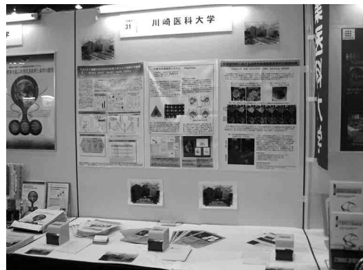
図1 科学・技術フェスタ in 京都(2010年6月5日)における川崎医科大学出展ブース。

翌2010年の産学官連携推進会議は、「科学・技術フェスタ in 京都 - 平成22年度産学官連携推進会議」と称して、やはり宝ヶ池で開催されたが5,121名の参加(公式HPより)があり、この時の特色は、高校生を招待し、会議場大ホールの机が並び前列はすべて高校生の指定席であり、ノーベル賞受賞者(小柴昌俊先生、小林誠先生、田中耕一先生、益川敏英先生)による高校生へのメッセージや自由討論、あるいは山崎直子宇宙飛行士からのメッセージ(ヒューストンから衛星中継で参加)と討論など、本邦の科学技術の次代を担う世代を主役に置いたことであった 6,7) 。この2010年度の「フェスタ」では、大学発シーズ紹介のブース展示が設けられるということで、本学でも医用中毒学、腎臓・高血圧内科学および衛生学の産学官連携に関連するシーズ紹介を出展した(図1)。なお、2011年度は9月21-22日に東京フォーラムで産学官連携推進会議が設けられたが 8) 、残念ながら学内所用などにより参加には至らなかった。