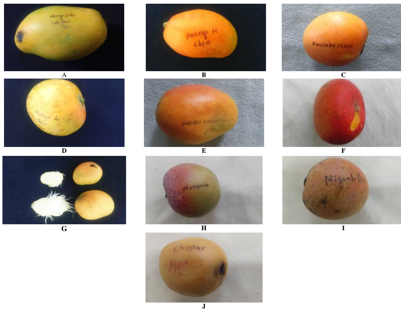
Figura 1 Forma de frutos: A. Mango bolsa de toro, B. Mango de chivo, C. Mango de perro, D. Mango pera, E. Mango mantequilla, F. Mango margarote, G. Mango chico y grande, H. Mango manzana, I. Mango miguelillo, J. Mango de chupar

Un estudio realizado sobre mangos nativos en Chiapas por Gálvez-López et al. (2007) concluyen con una amplia diversidad de frutos y semillas; que coincide con lo que se descritos en este estudio. Sin embargo, se debe resaltar que en nuestro trabajo hemos hallado características cualitativas no repor-