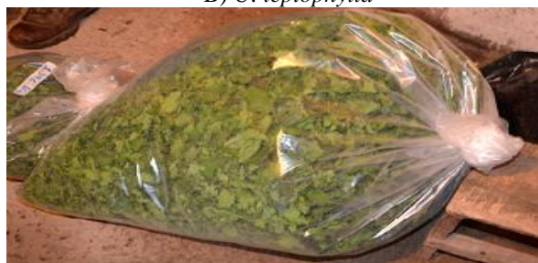
Figura 3 Comunidad Tondolique situado en la zona alta de la parroquia Quisapincha; A) U. urens L. B) U. leptophylla

La Tabla 2 muestra los padecimientos reportados tratados con especies de ortigas por las comunidades Quisapincha y San Fernando en el Ecuador. U. urens y U. leptophylla tienen los usos más reportados, U. flabelatta tiene dos usos, mientras que U. magellanica no se reportó para el tratamiento de ninguna enfermedad, por esta razón no aparece en la tabla 2. Parece que cada una de las especies tiene un uso particular, sólo en el tratamiento de los espasmos, los informantes reportan que pueden emplear U. leptophylla o U. urens indistintamente.