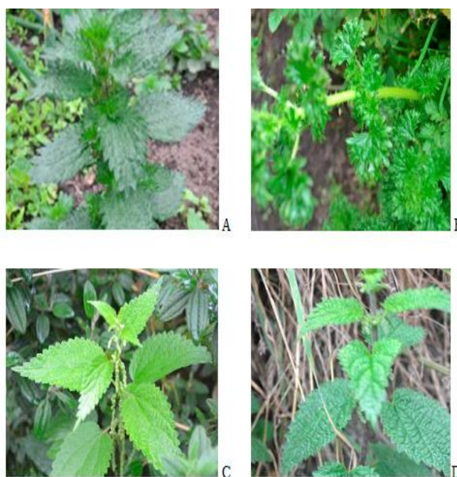
Figura 2 Especies de ortigas que crecen en tierras de Quisapincha y San Fernando, provincia de Tungurahua, Ecuador. (A) U. urens L. (ortiga de cerdo), (B) U. flabellata Kunth (ortiga blanca), (C) U. magellanica Juss. ex Poir (ortiga de paramo), (D) U. leptophylla Kunth (ortiga negra o de pared)

Los encuestados (17 personas) fueron 7 hombres y 10 mujeres, en general, tienen educación primaria, principalmente bilingüe (quichua y español), tienen un promedio de 49 años de edad y su actividad como sanadores se combina con actividades agrícolas y / o amas de casa. La mayoría de los informantes (9) obtuvieron sus conocimientos de la familia o sanadores en sus comunidades, a través de la experimentación empírica (7) y a través de formación (1) (Tabla 1).