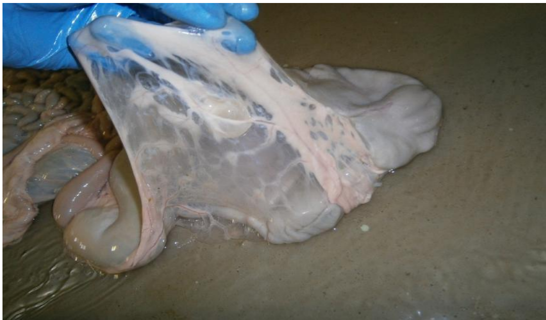
Figura 4 Cysticercus tenuicollis de diferentes tamaños