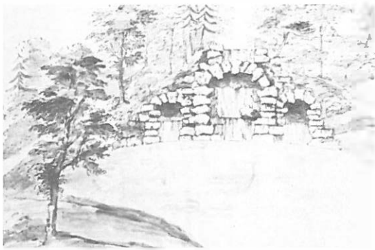
4.—W. Kent. Proyecto para la cascada en villa Chiswick.