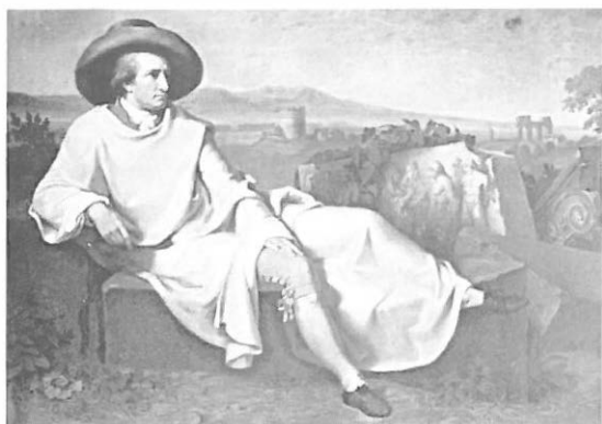
1.—TISCHBEIN: Retrato de Goethe en la campiña romana. 1787.