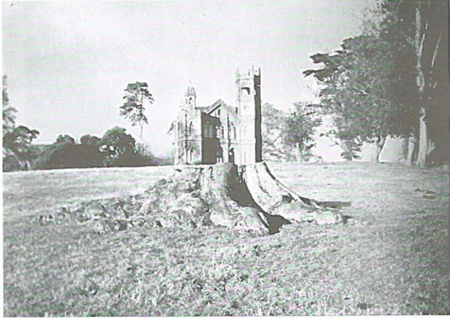
7.—J.Gibbs. 1741 .Templo gótico en Stowe.