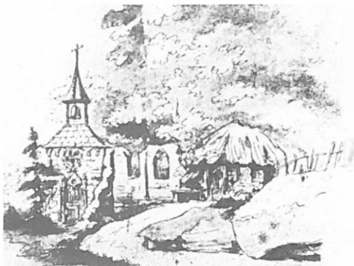
2.—Luisenkoster (Weimar). Dibujo de Goethe. 1778.