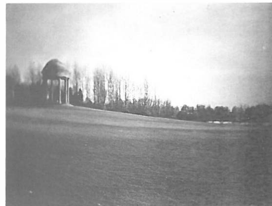
6.—Vanbrug. Rotonda en el parque de Stowe. 1717.