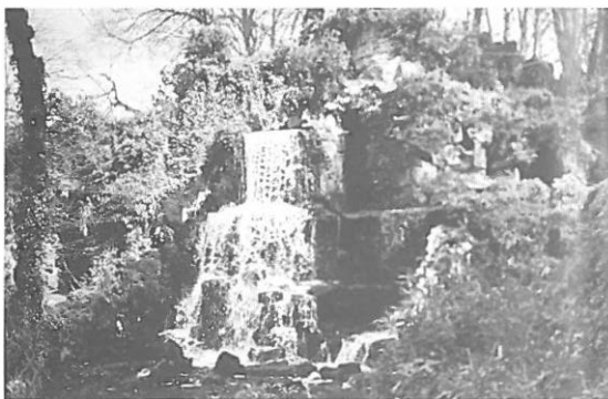
5.—Charles Hamilton. 1785. Cascada realizada en el parque que Capability Brown proyecta en Bowood.