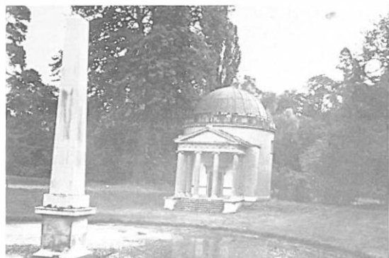
3.—W. Kent. Obelisco y templete de villa Chiswick.