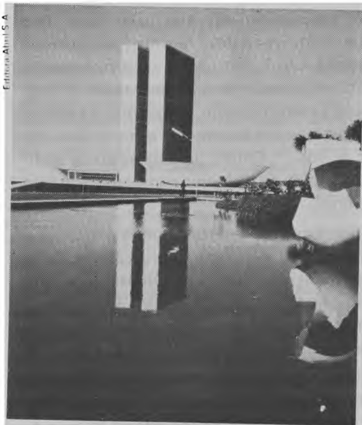
Edifício do Congresso Nacional.

O problema relevante não se aprisiona, portanto, naquela alternativa clássica , na qual teremos ou o impasse ou o faz-de-conta. Tra-