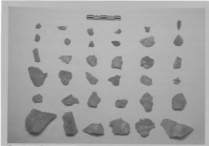
Fig. 3. Lascas de arenito silicificado encontradas no sítio Musa.

atestada por Costa (2009) em Iranduba e em alguns contextos próximos ao rio Negro. Além disso, encontramos material cerâmico nos areais, fato mais raro. Infelizmente não conseguimos estimar a datação dentro da área do empreendimento, não havia material para tal.