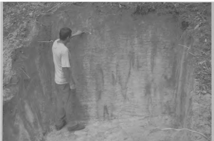
Fig. 2. Exemplo de perfil de sítio pré-cerâmico em areal (sítio Musa).

A maioria dos vestígios era de líticos lascados e modelados pelo desgaste de uso. Dois sítios não possuem material cerâmico, nem nas camadas superiores: Areal do Itapuranga e Bacurau, enquanto que os outros dois têm presença de fragmentos cerâmicos muito deteriorados na superfície. O diagnóstico da área do empreendimento no Tarumã se mostrou extremamente interessante. Pudemos confirmar a recorrência entre areais e sítios pré-cerâmicos,