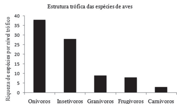
Figura 2: Estrutura trófica das espécies de aves registradas no "Mato do Silva" durante o período de amostragem.

A estrutura trófica da avifauna do "Mato do Silva"