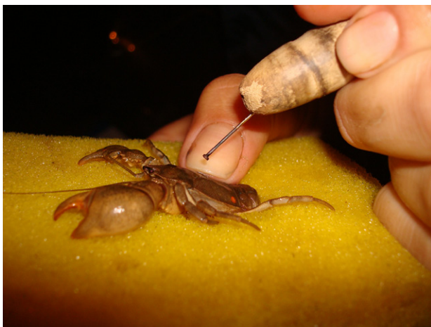
Figura 3. Marcação de exemplar de A. marginata , pelo método de cauterização a quente utilizando agulha aquecida ao rubro.