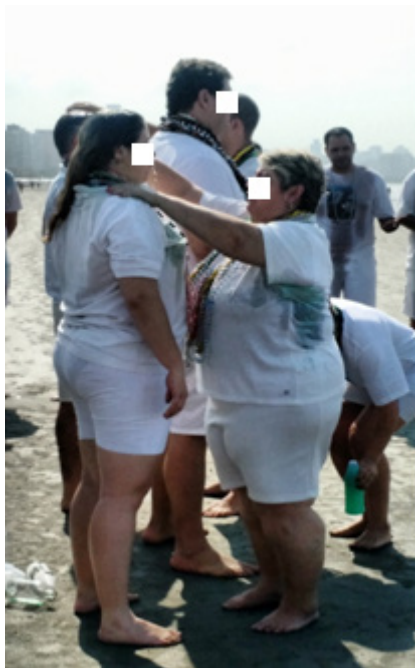
Figura 7: banho de Amaci.

áurico, bem como confirmar as entidades trabalhadoras da coroa daquele médium (SOLA, 2014, n.p.).