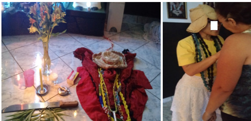
Figura 13: ponto da Madrinha e Baiana atendendo.