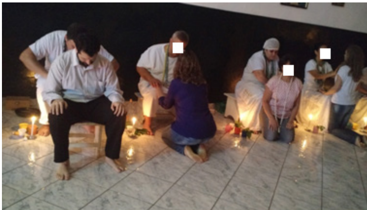
Figura 6: preto velho atendendo a assistência.