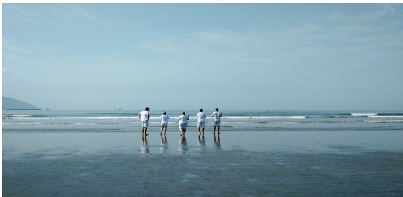
Figura 8: médiuns abrindo o trabalho de descarrego.

Após a abertura são convidados para entrarem no mar, por vez: os médiuns de psicofonia , os cambones e, por fim, a assistência.