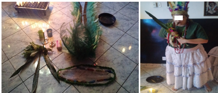
Figura 12: ponto da Madrinha e Cabocla.