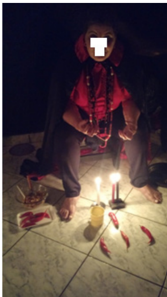
Figura 15: ponto da Madrinha e MèdiuM incorporada de Exu.