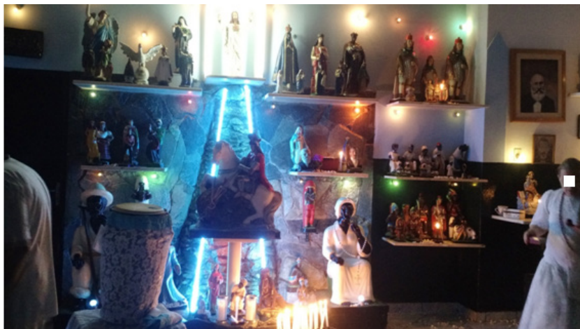
Figura 2: altar com as imagens de santos e orixás, e um atabaque à frente.

Os trabalhadores da Casa, médiuns de psicofonia e cambones , chegam e passam por um corredor ao lado do salão que está localizado a assistência. Há uma entrada na lateral para acessarem o espaço destinado a eles (não é preciso passar pela assistência para adentrarem ao espaço). No local em que os trabalhadores estão, há um altar com as imagens dos santos, entidades e orixás. No centro do altar há uma cachoeira construída com pedras e água corrente, com lâmpadas azuis claras na lateral. Há, também, dois atabaques — instrumentos musicais, e estão situados do lado esquerdo do altar.