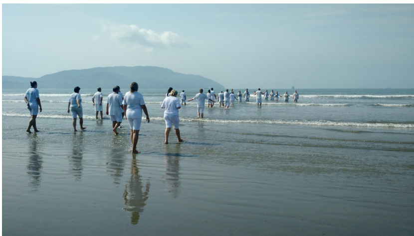
Figura 9: médiuns de psicofonia, cambones e assistência entrando ao mar.

Após a abertura são convidados para entrarem no mar, por vez: os médiuns de psicofonia , os cambones e, por fim, a assistência.