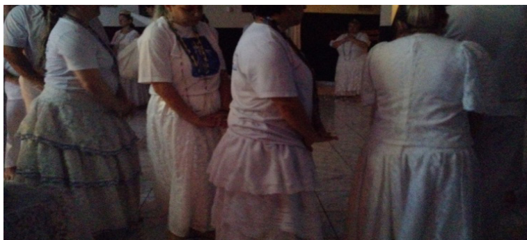
Figura 11: roda fazendo a gira aos pretos velhos.