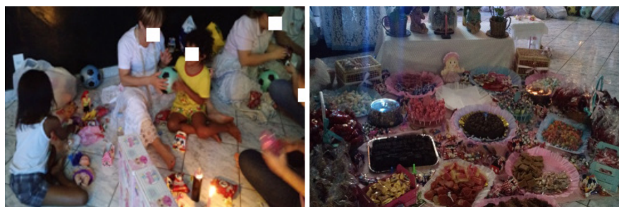
Figura 14: crianças com as crianças e Doces para receber as crianças. Fonte: da autora