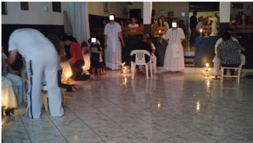
Figura 1: sessão de atendimento. Atrás das cambones (vestidas de branco e posicionadas em pé) vê-se a mureta que separa os ambientes.

Ao adentrar no salão, encontram-se bancos e cadeiras destinados para a assistência e um espaço para os trabalhadores da Casa. Esta é a caracterização de um espaço intermediário, na qual separa a assistência (os consulentes) dos trabalhadores da Casa. Este espaço é separado por uma pequena mureta. Os consulentes acompanham os trabalhos sentados nos bancos, e, após o início do trabalho (com oração, defumação e pontos cantados) são atendidos um por vez em ordem de chegada.