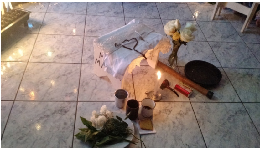
Figura 4: espaço destinado à Madrinha do Centro, que receberia o espírito de preto velho.

São, aproximadamente, 30 trabalhadores da Casa, e atendem mais de 150 pessoas por encontro.