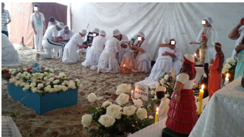
Figura 10: atendimento na Praia.

No período da noite, o ambiente foi preparado para ser realizado o trabalho como de costume, porém, à beira mar. Para isso montou uma tenda/barraca e, dentro, havia o altar e toda a preparação que acontece no Centro. O trabalho seguiu o mesmo ritual do Centro, e os médiuns de psicofonia deram passagem aos pretos velhos, caboclos, baianos e crianças. Ao final do trabalho, foi enviado um barquinho azul com flores, cartas, perfumes, entre outros materiais, como forma de agradecimento à lemanjá . Cada um que estava presente pegou botões de rosas e dedicou à lemanjá , jogando-as ao mar.