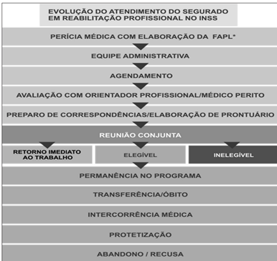
Figura 1. Fluxograma dos passos seguidos pelo segurado