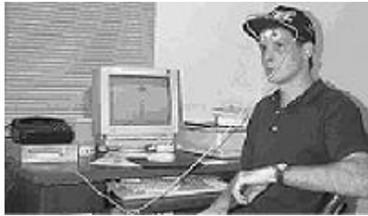
Figura 3 – Equipamento para emulação de mouse

A partir dos dados e das observações obtidas em laboratório, foram feitos os ajustes para adaptar o dispositivo às pessoas que não possam utilizar um mouse convencional.