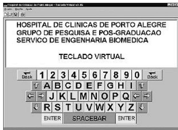
Figura 2 – Programa editor de texto com o teclado virtual

O protótipo foi testado em laboratório por 25 pessoas normais, obtendo-se uma base de dados utilizada para otimizar o ajuste de sensibilidade do sinal EMG, zona neutra e velocidades de deslocamento do cursor em função da inclinação da cabeça.