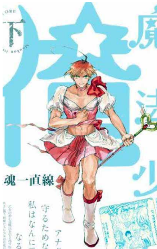
Figura 5- No mangá Mahou Shoujo Ore, a protagonista (uma garota frágil) se transforma em um homem forte e musculoso para defender seus amigos e gera muitas piadas ao tentar salvar os meninos em sua forma masculina.

A situação de comportamento masculino e feminino é tão diverso e complexo nos mangás que praticamente há um nome de classificação para cada tipo de personagem (personalidade) entre homens e mulheres no mangá (Vide Quadro 1). Leitores e roteiristas descrevem, em suas histórias, os mais diversos tipos que são reconhecidos pela relação entre a caracterização visual (vestimenta, adereços, posicionamento do corpo) e a caracterização da personalidade. É o princípio da definição de gênero. Há uma regra nos mangás de definição das coisas por contrastes estéticos e conteudísticos. Assim, sempre haverá homens e mulheres submissos, dominadores, sofredores, tímidos e assim por diante. Não há um padrão absoluto de personalidade entre homens e mulheres. Isso torna os mangás muito passíveis de discussão sobre a questão do gênero, assim como os conflitos de gênero.