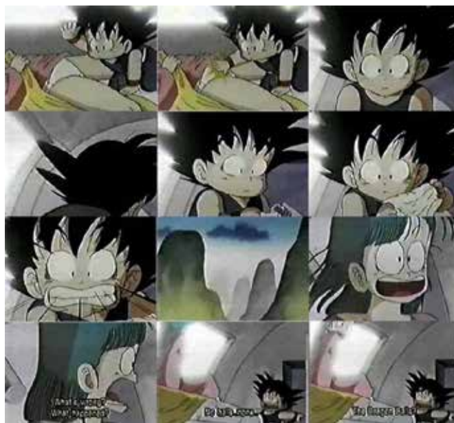
Figura 7 -Cena do anime Dragon Ball Z onde o Goku criança descobre ao tocar a genitália de sua amiga Bulma que ela não tem “bolas” e nem “pinto”. Uma cena cômica sobre a diferenciação orgânica entre os sexos e a descoberta ocasional. Fonte: http://www.kamisama.com.br/wp-content/uploads/2010/11/censnoballstv2.jpg

Como a comicidade é um elemento narrativo nos mangás independente de seu subgênero narrativo (se de terror, drama, cotidiano, aventura medieval etc.), estas questões se instauram na história por vias do elemento cômico através de imagens em SD ( super deformed ), onde aparecem as miniaturas dos personagens ou das metalinguagens visuais (quedas de pernas-pra-cima, gotas em narizes, exagero nas expressões faciais (Cf. BRAGA JR, 2011) e sempre, pela comicidade apresentam situações de educação sexual.