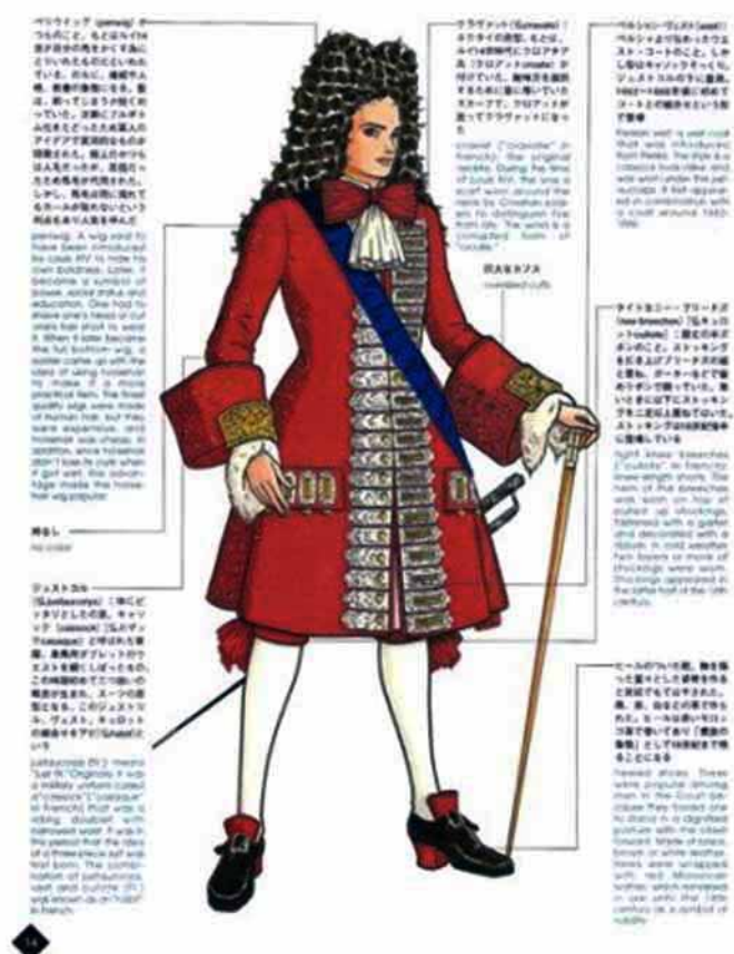
Figura 1 - Termo masculino de Luís XIV. A vestimenta incluía peruca, salto alto, maquiagem, luvas e laços nos pés e pescoço como parte da vestimenta tida como masculina. Hoje estes mesmos adereços são associados totalmente à feminilidade. Isso nos mostra que os padrões de vestimenta são artificiais e coisas de mulher e de homem são voláteis com o tempo. O mesmo ideal deve ser percebido entre as roupas etnicamente constituídas como togas masculinas entre árabes e africanas que na cultura ocidental são vistas como vestidos femininos e assim por diante.

Em determinados casos não há congruência entre o tipo de órgão sexual de nascimento do indivíduo, sua mentalidade em relação à sexualidade ou seu comportamento de gênero. Assim surgem crossdressings , hermafroditas, transexuais, travestis, meninas lésbicas, meninos gays, meninos afeminados, meninas masculinas, pessoas andrógenas entre outras diversas identidades sexuais.