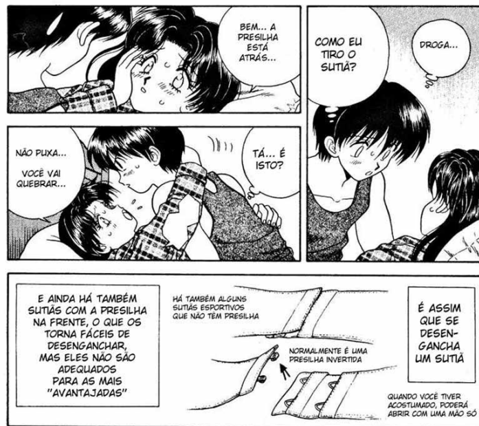
Figura 6 - Cena pedagógica do mangá Futari Ecchi ensinando a desabotoar o sutiã na hora dos sexos. Foram publicadas 42 edições no Brasil, mostrando tudo o que é necessário saber sobre sexo através da vida do casal, com muitas cenas de prevenção de DSTs.

O riso do travestismo masculino ou feminino, às vezes, pode ser confundido com falta de respeito ou desaprovação. É o ridículo medieval do humor que retorna no imaginário social. Entretanto, o mesmo riso, no caso dos quadrinhos e no desenho de humor em geral, pode ser um veículo para a naturalização da representação. Acostumar-se com o fato e torna-lo natural e frequente é um meio para entender que a caracterização fora dos padrões heteronormativos é possível e não mais estranha (ao passo que se naturalize). Lembremo-nos que muitos dos travestis seguem carreira de comediantes ou