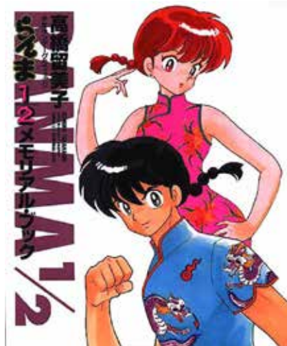
Figura 3- Capa de Ranma ½ . Um menino que vive como menina, com cenas satíricas de um menino que, ao se molhar, vira uma menina. O "½" do título se refere ao garoto que é "metade" garota.