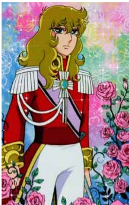
Figura 4 - Lady Oscar do mangá "A Rosa de Versailles". Uma menina que vive como menino. Oscar vive o conflito entre seu papel masculino e seus desejos femininos de amar um homem.