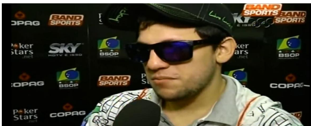
Figura 4: Momento da entrevista em que o banner em evidência.

As câmeras do programa mostram as logomarcas das empresas patrocinadoras a medida em que a partida está sendo disputada e os jogadores são observados por diversos ângulos diferentes. Já uma câmera específica na região superior e central da mesa, filma toda movimentação dos jogadores na mesa.