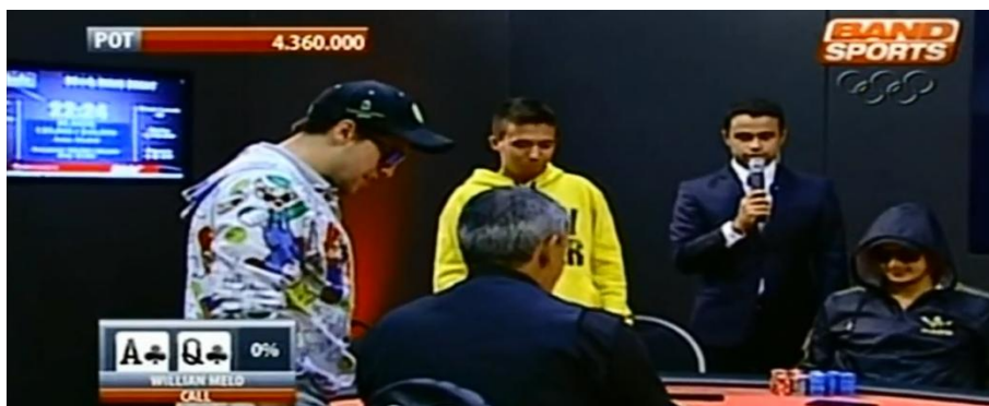
Figura 5: Imagem da transmissão do BSOP São Paulo 2014 Disponível em: < www.youtube.com/pokervideosbrasil >