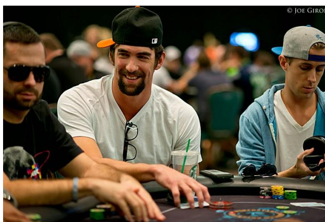
Figura 1: O nadador Michael Phelps disputando um torneio oficial organizado pelo Poker Stars

O aumento da publicidade, que faz grandes investimentos no setor, e a modernização das organizações de torneios, tanto os nacionais como internacionais, onlines ou presenciais são alguns dos indícios de que o Poker cresceu e se popularizou. Atualmente, é possível ver anúncios de grandes empresas ligadas ao Poker , como o exemplo do PokerStars 2 , que busca associar a imagem das partidas de cartas com grandes jogadores de outras modalidades esportivas como o futebol, no caso dos brasileiros Neymar Jr e Ronaldo de Lima, e da natação, como o maior medalhista olímpico, Michael Phelps. De fato, muitos desses garotos propaganda viraram adeptos ao esporte e tornaram o público ainda mais diversificado. Para Morin (2002), a procura de um público variado implica a procura de variedade de informação ou no imaginário: à procura de um grande público implica a procura de um denominador comum.