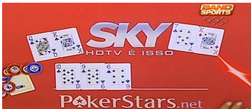
Figura 3: Imagem retirada do vídeo da transmissão da emissora Band Sports. Disponível em: www.youtube.com/pokervideosbrasil

As entrevistas após a eliminação ou saída da mesa fazem parte da pauta do programa Poker Night . No momento em que o jogador paraguaio, vice-colocado no torneio, por exemplo, está sendo entrevistado é possível observar o banner do BSOP, com todas as marcas patrocinadoras do evento. Ao todo, são três empresas privadas: a SKY , Poker Stars e Copag . Ainda a respeito do conteúdo analisado, é possível observar a logomarca do BSOP ( Brazilian Seires of Poker ) e a da própria emissora responsável pela cobertura e transmissão do evento, a Band Sports.