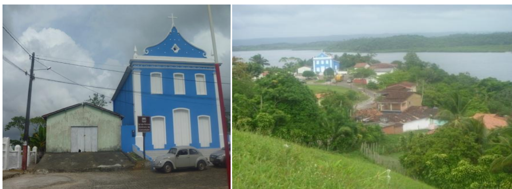
Figura 02: Bairro do Cambuizo.