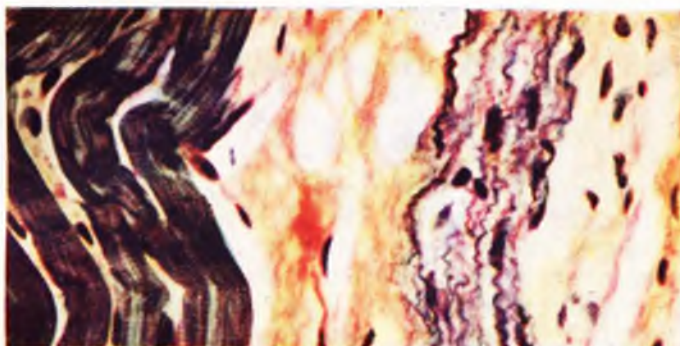
Foto 1 — Fibras musculares do tecido cardíaco (à esquerda), e do nó sinu-atrial (à direita). Hematoxilina férrica de Heidenhein. 1200 X.