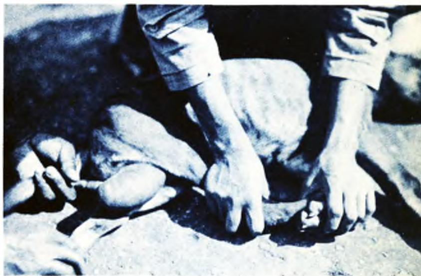
FIGURA 2 - Ilustração referente ao caso nº 2.