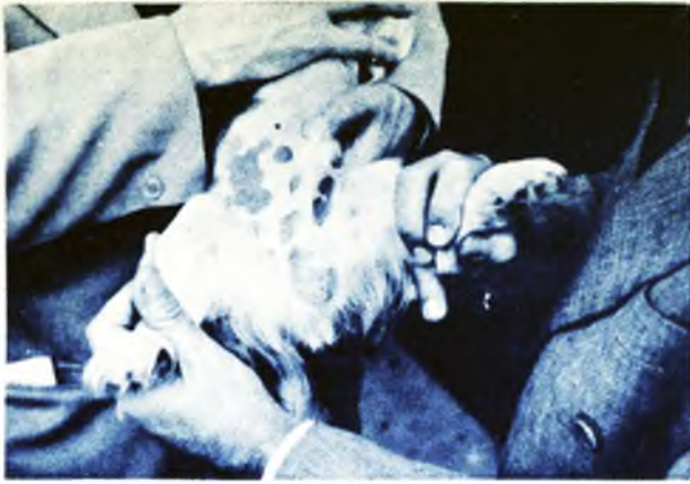
FIGURA 3 - Ilustração referente ao caso nº 2.