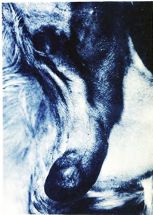
FIGURA 4 - Ilustração referente ao caso nº 3.