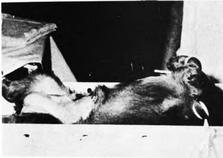
FIGURA 5 - Ilustração referente ao caso nº 4.