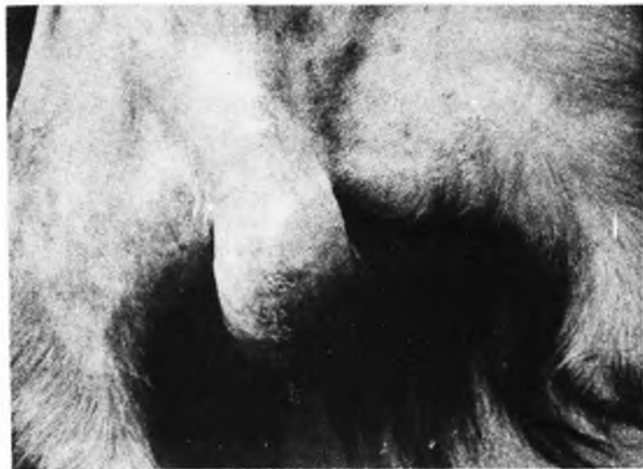
FIGURA 6 - Ilustração referente ao caso nº 5.