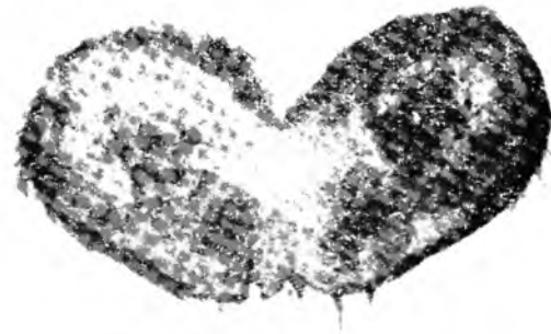
Caso II — Superficie de corte