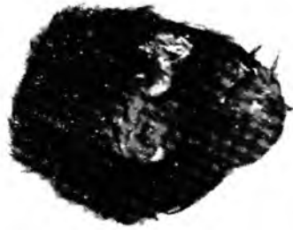
Caso II — Monstro Anidano