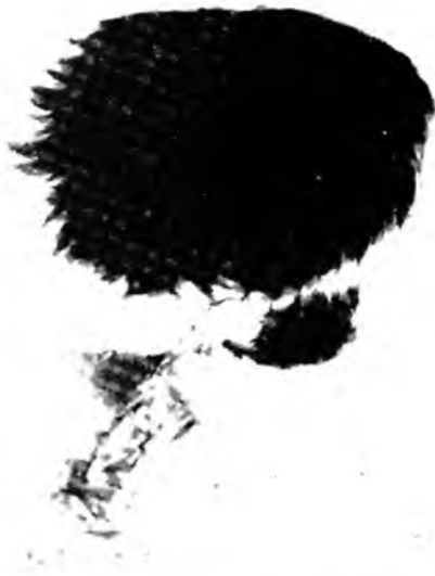
Caso I — Monstro Anidiano