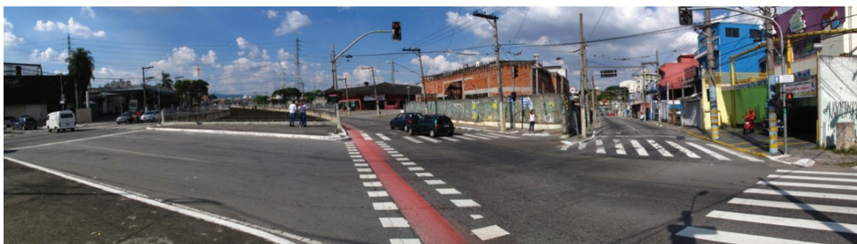
Figuras 5 a 8 – Trecho 2.