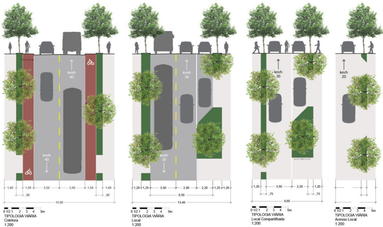
Figura 13 – Compartimentação do viário e calçadas. Elaboração: equipe de alunos da AUP 5853.