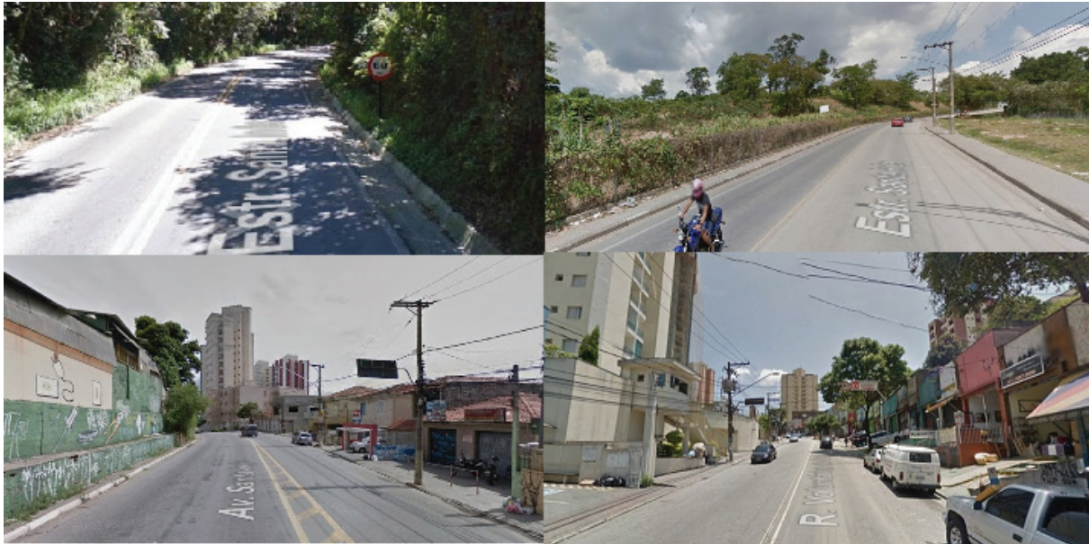
Figura 4 – Diferentes dimensionamentos e tipologias de uso das vias no Trech’o 01.