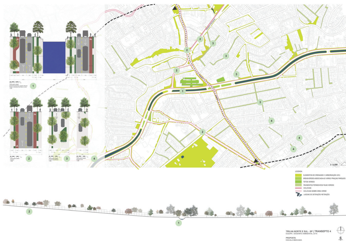
Figura 14 – Transecto 04- Av. Imirim x Av. Eng. Caetano Álvares. Elaboração: equipes de alunos da AUP 5853.

After defining the above guidelines, they were implemented over the seven identified transects. As a result, it was possible to see how the environmental design could simultaneously resume ecosystem functions in the city and impact the local landscape positively. Figure 14 illustrates the application of the guidelines described in the area of intersection between the Imirim and Engenheiro Caetano Álvares Avenues.