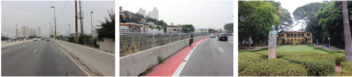
Figuras 9 a 11 – Trecho 3- Área da várzea até Parque da Água Branca. Figures 9 to 11 – Section 3 - Floodplain area until Água Branca Park.