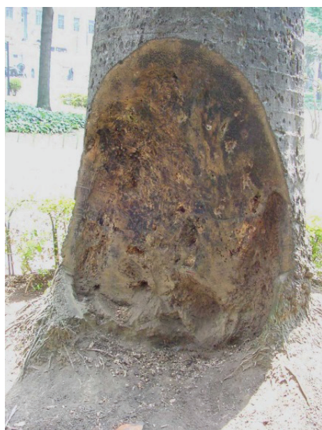
Figura 2 – Ataque intenso de organismos xilófagos no estipe da palmeira nº 2 (escala = 0,10 m).

Verificou-se uma lesão de proporções significativas nos estipes das palmeiras nºs 2 (Figura 2) e 5, que representavam a perda aproximada de 50% e 25% da seção, respectivamente. Nestas regiões constatou-se o apodrecimento intenso e ataque de cupins subterrâneos. Ressalta-se que o lenho nestes locais, não será restituído pela planta, havendo a tendência do processo de biodeterioração progredir, caso nenhuma providência seja realizada.