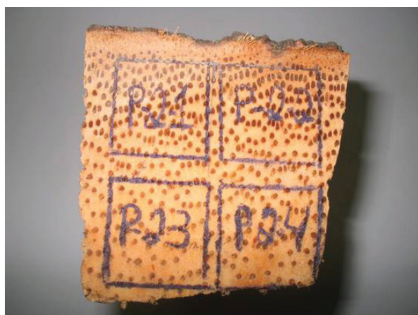
Figura 3 – Posição dos corpos-de-prova para os ensaios físicos e mecânicos em amostra de palmeira-imperial.

Esta informação também foi confirmada nos perfis das prospecções do caule (Gráficos 1 e 2), que corroboraram a maior resistência mecânica da região periférica, em relação à região interna.