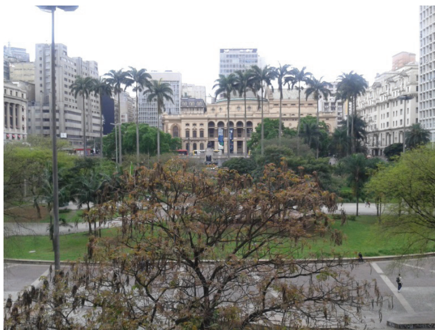
Figura 1 – Vista geral das palmeiras-imperiais, com o Teatro Municipal ao fundo.