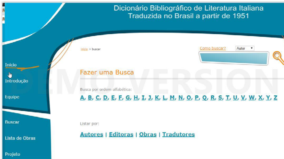
Figura 1 – Interface de Consulta do Dicionário Bibliográfico de Literatura Italiana