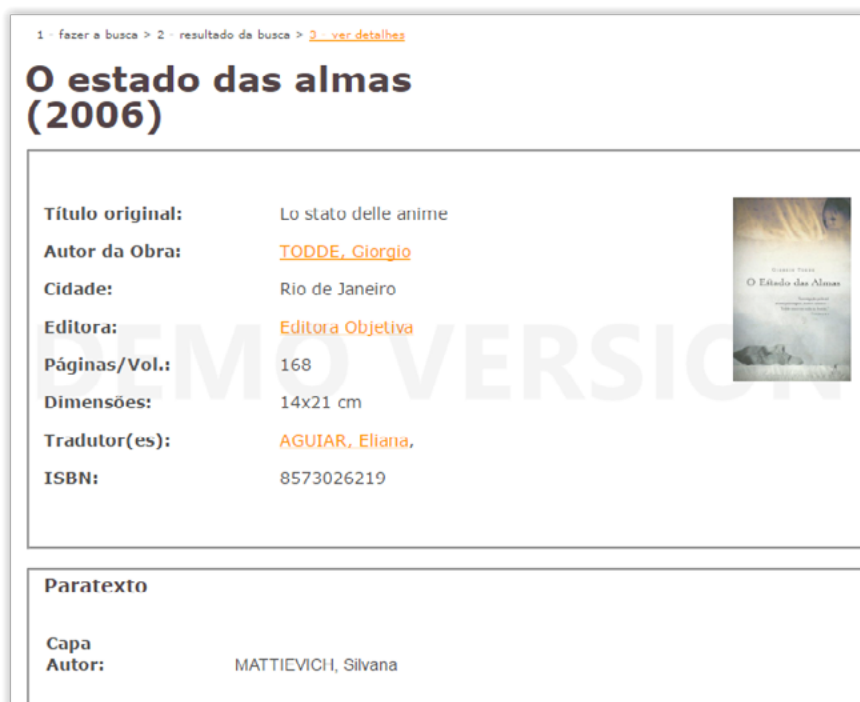
Figura 2 – Apresentação do Registro na Base de Dados Bibliográfica