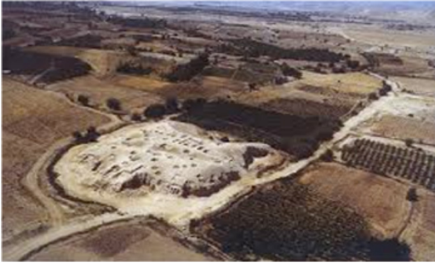
Fig. 4. Vista aérea do noroeste do complexo multifuncional em Jericó. No primeiro plano: restos do ginásio ou do palácio, o teatro em sua encosta sul e a pista de corridas do hipódromo na área cultivada.