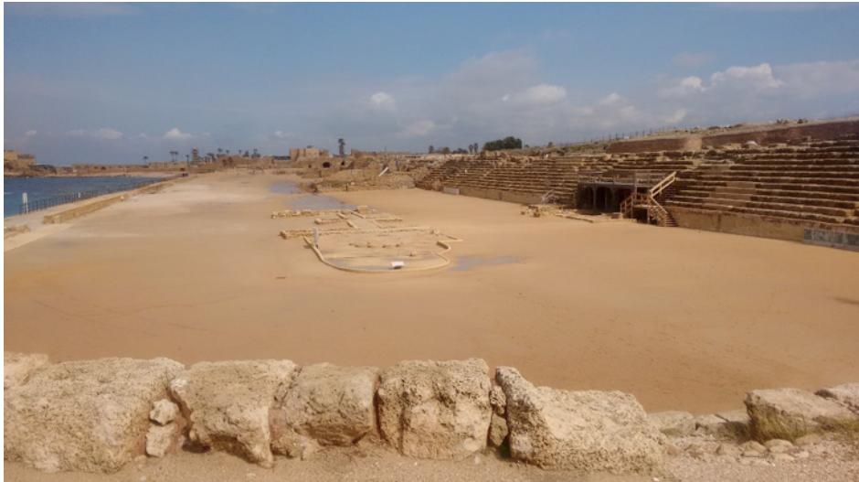
Fig. 2. Vista do Hipódromo de Cesareia.