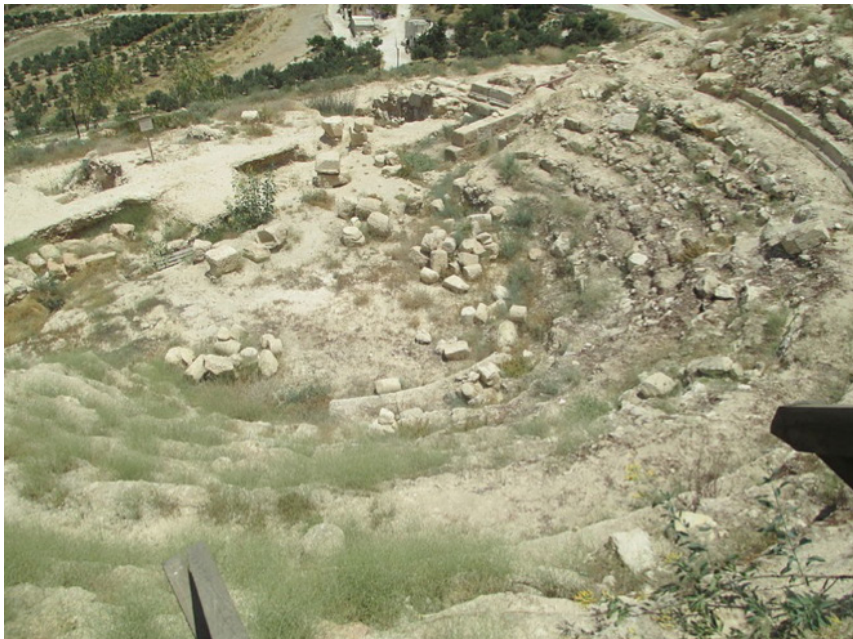
Fig. 5. Vista aérea do teatro de Herodium.

Aparentemente não era fácil assistir às performances que ocorriam no palco dessa câmara; Zeev Weiss (2014: 23) sugere que este era um pequeno cômodo real destinado a reuniões íntimas ou eventos privados do rei e de seus amigos próximos. As entradas laterais davam acesso à orquestra, e a riqueza do palco em frente à cavea é atestada por seus muitos elementos arquitetônicos, alguns decorados com afrescos, descobertos nos destroços.