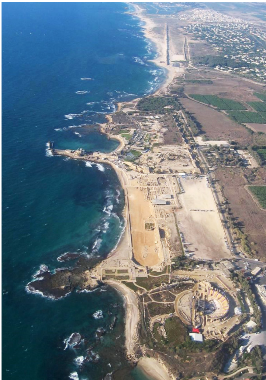
Fig. 1. Vista aérea de hipódromo-anfiteatro e do teatro de Cesareia.

foi decorado com gesso pintado, assim como o piso da orquestra, cujas 14 camadas de gesso continham padrões florais e vegetais (Frova, 1966: 93-112, 128-145).