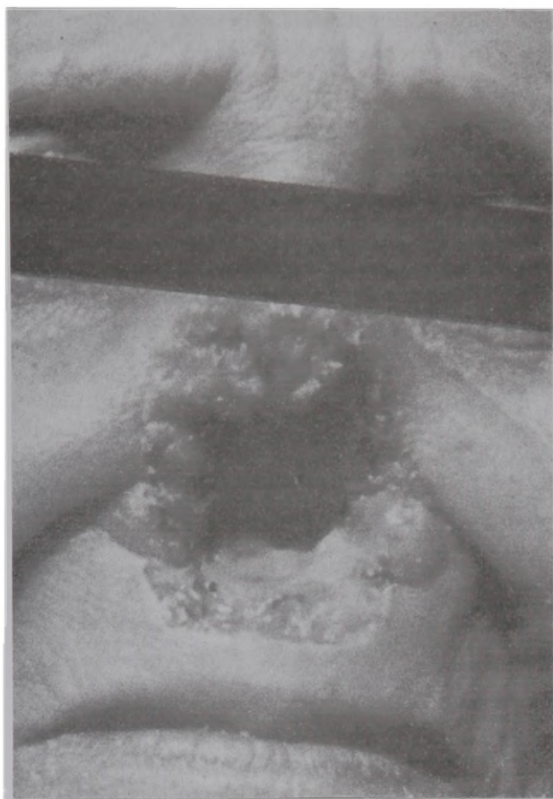
Fig. 3 – Un caso actual de LTA de forma mucosa causado por el parásito L.(V.) braziliensis . Secuelas de destrucción ósea ocurren en los cornetes inferiores y el paladar duro.

tampu por haberse detectado algunos casos compatibles y aplicamos el método paleopatológico. Luego, describimos los casos que presentaban señales de destrucción de la cavidades nasal y oral, y descartando otros que tenían alteraciones tafonómicas. Se tomaron fotos y slides de la posible casuística. Además, realizamos la búsqueda de fichas y registros de procedencia en el centro de catalogación y registro del MNAAH. Otros criterios para escoger este sitio fueron la conservación del material, poseer contexto arqueológico, tratarse de un grupo agrícola y su proximidad al área endémica de LTA. Asimismo, para la estimación de la edad y del sexo de los cráneos paleo-