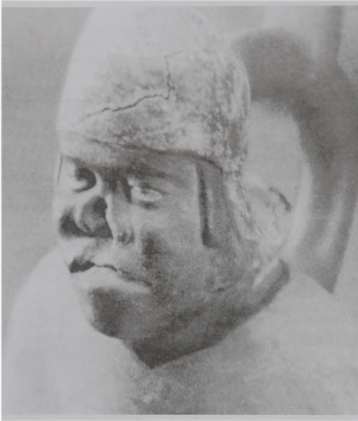
Fig. 2 – Representación sugestiva de LTA de forma mucosa en la cerámica Mochica, siglos I-VII después de Cristo. Su antigüedad es casi 1,000 años antes del imperio Inca.

arqueológico, únicos documentos de carácter autóctono y “ sui generis ” para estudiar la presencia de focos endémicos de enfermedades, permitiendo su reconstrucción paleoepidemiológica en este segmento del proceso histórico y regional andino. A partir de la década de 80 surge la Nueva Paleoepidemiología que se sustenta de 3 pilares: el contexto arqueológico o biocultural, la incorporación de técnicas biomédicas modernas y el contraste analítico del diagnóstico diferencial (Mendonça de Souza 1995; Buikstra & Cook 1992, 1980; Ortner 1992; Weiss 1984; Ubelaker 1982; Ortner & Putschar 1985; Zimmerman & Kelley 1982). Asimismo, la cerámica Mochica, elaborada casi 1,000 años antes del desarrollo de los Incas, refuerza la hipótesis epidemiológica de su presencia básicamente entre