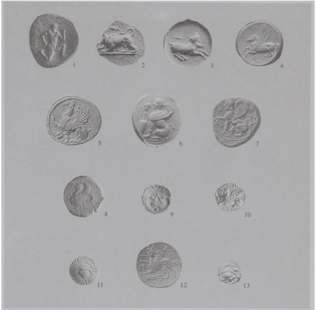
Prancha I – 1. Cnossos. Minotauro correndo. S. [SNGCop. 368]; 2. Sicione. Quimera. S.IV a.C. [MAE/USP 75/d.1.2]; 3. Gelas. Divindade fluvial Gelas. S. [MAE/USP66/4.2]; 4. Corinto. Pégaso. [MuBB 49]; 5. Abdera. Grifo. S. VI-V a.C. [BM doubles,1528]; 6. Quios. Esfinge. S. [MHN 18.2]; 7. Idalion (Chipre). Esfinge. [BM doubles,2758]; 8. Siracusa. Hipocampo. S. IV a.C. [MHN 11.62]; 9. Neápolis (Macedônia). Gorgoneion. Moeda perfurada. [BR 62]; 10. Abdera. Grifo. [MHN 13.19]; 11. Macedônia. Gorgoneion no interior de escudo macedônico. S. III-II a.C. [BR258]; 12. Panticapeum. Grifo. S. IV a.C. [BM doubles, 1639]; 13. Samos. Javali alado. [BR 88].

Abreviaturas: MHN – Museu Histórico Nacional/ Rio de Janeiro; MuBB – Museu e Arquivo Histórico do Banco do Brasil/ Rio de Janeiro; MAE/USP – Museu de Arqueologia e Etnologia da Universidade de São Paulo; BR – Coleção Bernardo Ramos/ Manaus; BM doubles – Monnaies grecques antiques provenant des doubles du British Museum des collections de feu le général A.L.Bertier de la Garde et de divers autres amateurs . Genebra, Naville, 1923; SNGCop. – Sylloge Nummorum Graecorum. The Royal Collection of Coins and Medals. Danish National Museum . Vol. 3, Greece: Thessaly to Aegean Islands. Republicação pela Sunrise Publications, N. Jersey, 1982.