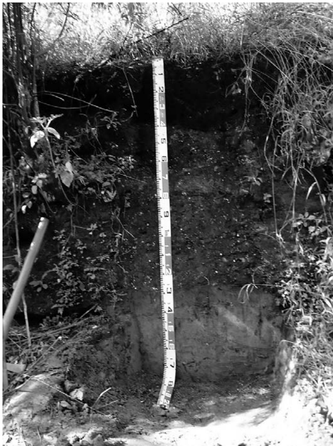
Fig. 4. Perfil amostrado de área adjacente ao Sítio Moraes.