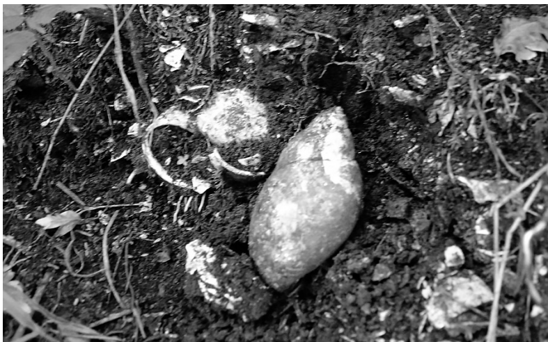
Fig. 6. Detalhe do principal caramujo ( Megalobulimus spp.) componente do sítio Moraes, município de Miracatu - SP.

determinação dos teores de cálcio total (Tabela 5). Esta metodologia é mais apropriada para análise dos horizontes dos sambaquis permitindo diferenciar de forma mais evidente as áreas de concentração das conchas de outras camadas sem deposição de material conchífero, mas com aumento dos teores de Ca_t devido à lixiviação e acúmulo de cálcio na forma iônica e não devido à deposição. Este fenômeno é o que provavelmente ocorreu nos horizontes AB, BA e B.