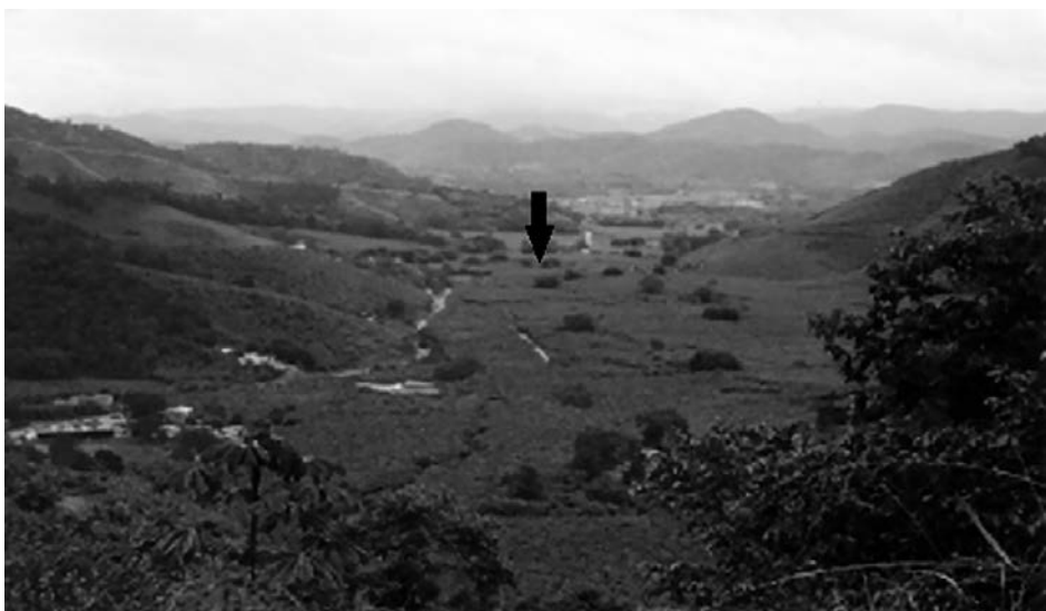
Fig. 2. Vista do Vale do Ribeirão Moraes, seta indicando a localização do sítio arqueológico; a vegetação circundante é um bananal.