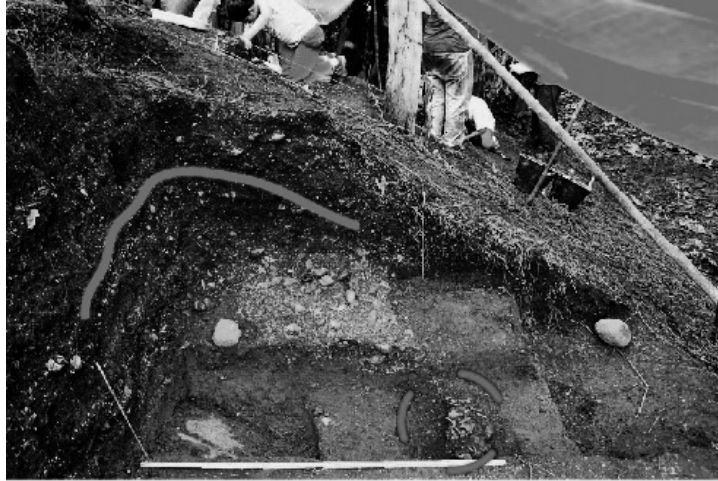
Fig. 5. Detalhe do perfil de solo desenvolvido de depósitos de conchas (sambaqui fluvial) no município de Miracatu - SP.

tudos comprovando a origem biogênica do P nos sambaqui também deverá ser objeto de pesquisa.