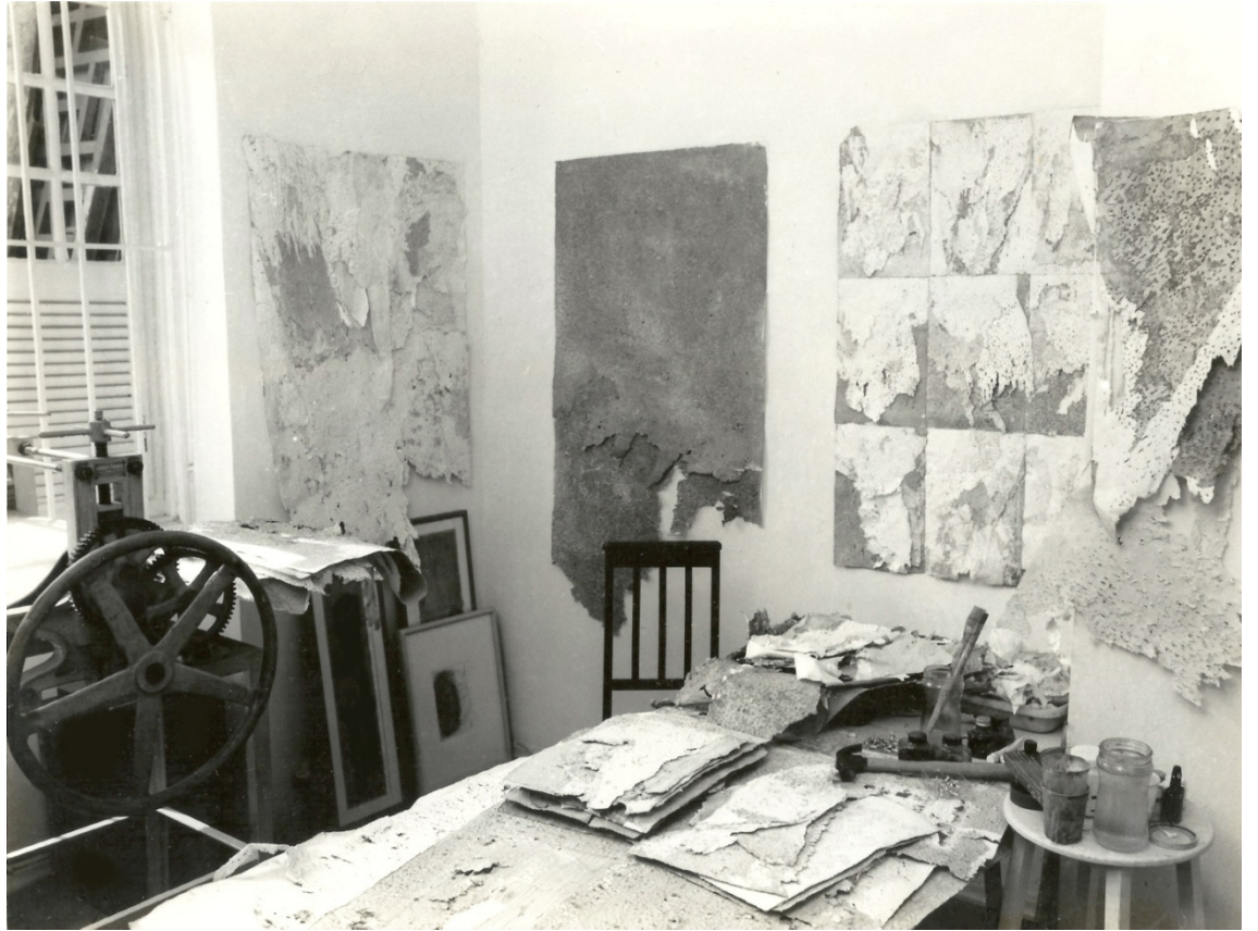
(03_ Vista do ateliê, Rio de Janeiro [1994]. Foto: Iggy Wanderley)