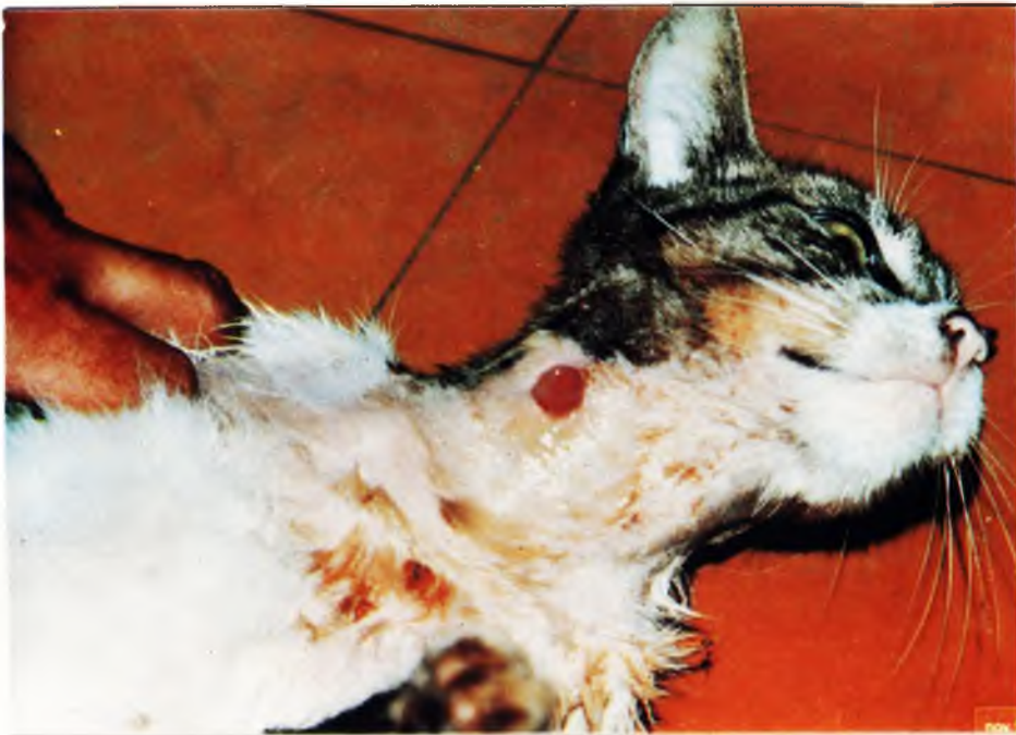
FIGURA 1 – Gato com abscesso fistulado purulento no pescoço