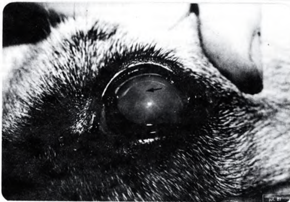
Fig. 1 – Forma jovem de D. immitis localizada na câmara anterior do globo ocular.

Com base nos estudos morfológicos por nós realizados e nos trabalhos supracitados, concluímos tratar-se de D. immitis , localizada erradicamente na câmara anterior do globo ocular de cão doméstico.