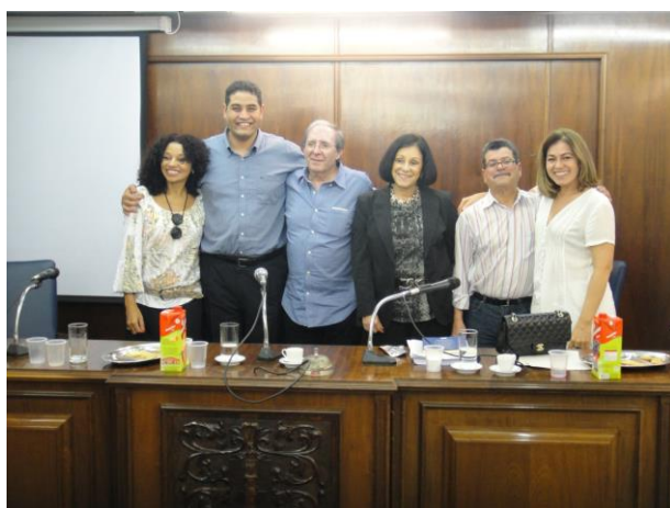
Figura 5: Banca de Defesa do Doutorado em Letras de Língua Portuguesa, FFLCH, USP, 2012