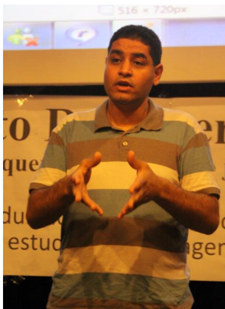
Figura 4: Palestra sobre a História do Egito no Sindicato do Jornalistas de São Paulo, 2011

Em 2011, retornei ao Egito para concluir meu doutoramento em Língua Espanhola e defender a tese. Na época, testemunhei a rebelião do povo egípcio contra o regime autoritário instaurado no governo há muito tempo. Quando voltei ao Brasil para continuar com o projeto de doutoramento em Letras - língua portuguesa, meu testemunho desse levantamento permitiu uma participação ativa na sensibilização do público brasileiro em cursos, entrevistas e artigos jornalísticos da história do Egito e sua realidade social.