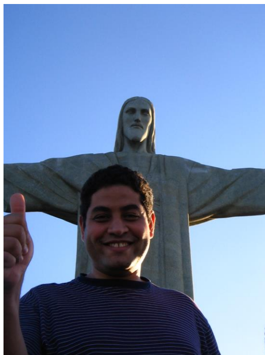
Figura 7: Minha primeira visita ao Rio do Janeiro no ano 2008

Avançado de Cultura Contemporânea da Universidade Federal do Rio de Janeiro. Tais encontros reuniam professores de diversas áreas de diferentes universidades para discutir problemas da cultura contemporânea. Meu trabalho era focado na Memória cultural das músicas de Chico Buarque de Hollanda .