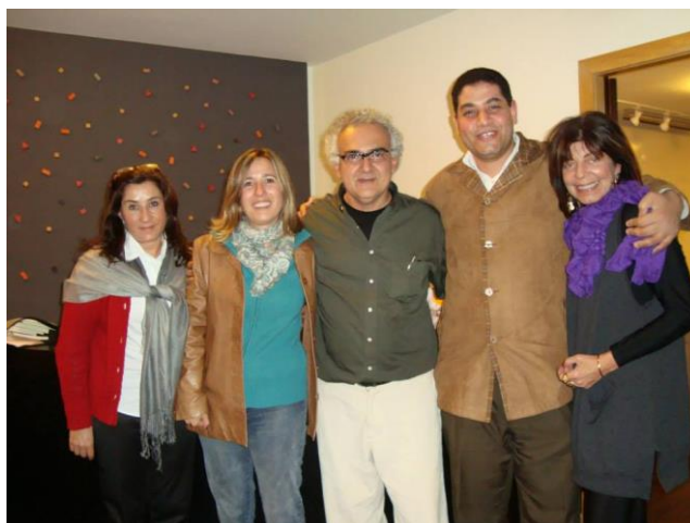
Figura 3: Curso com o Milton Hatoum na Casa do Saber, São Paulo, 2010

Em 2011, retornei ao Egito para concluir meu doutoramento em Língua Espanhola e defender a tese. Na época, testemunhei a rebelião do povo egípcio contra o regime autoritário instaurado no governo há muito tempo. Quando voltei ao Brasil para continuar com o projeto de doutoramento em Letras - língua portuguesa, meu testemunho desse levantamento permitiu uma participação ativa na sensibilização do público brasileiro em cursos, entrevistas e artigos jornalísticos da história do Egito e sua realidade social.