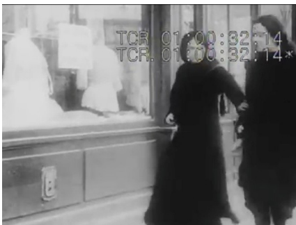
Figura 1: Amiga de Louise (provavelmente a personagem Laure) para Louise diante da loja.