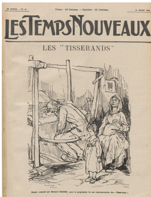
Figura 15: “Desenho composto por Bernard NAUDIN, para o programa das nossas apresentações de “Tisserands””.