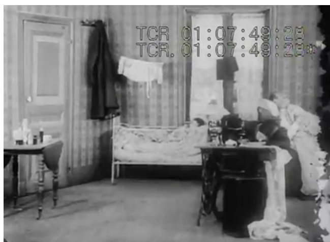
Figura 16: Em seu pobre domicílio, Louise cai cansada sobre a máquina de costura. Ao fundo, também dormem seu marido doente e seu filho.

Fonte: Les misères de l'aiguille (As misérias da agulha) , 1914