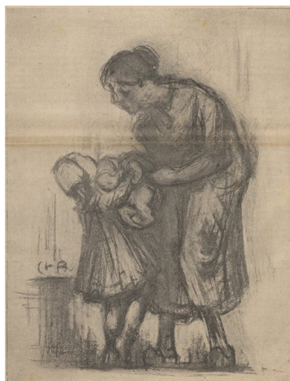
Figura 6: Sem título (uma mãe e duas crianças). Charles Angrand.