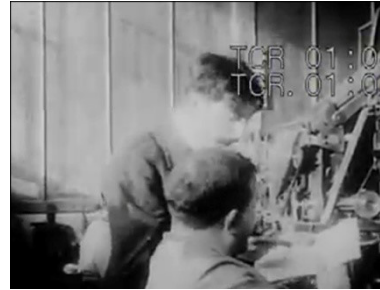
Figura 12: Caminha em direção ao primeiro plano, e passa as instruções ao segundo funcionário.