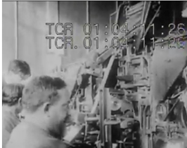
Figura 11: No fundo do plano, o contra-mestre passa instruções em tom energético ao funcionário.