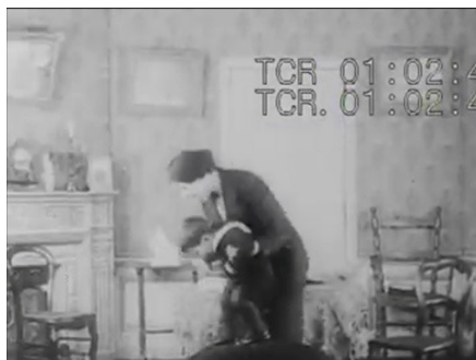
Figura 8: O pai chega e brinca efusivamente com a criança.

Fonte: Les misères de l'aiguille (As misérias da agulha) , 1914