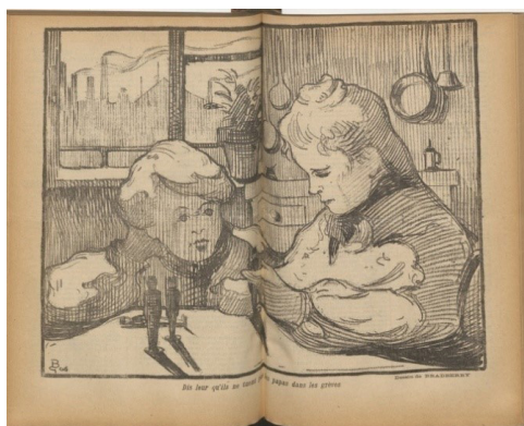
Figura 5: Diga-lhes que não matem os papais nas greves . Georges Bradberry.