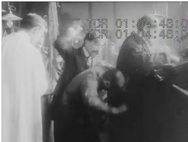
Figura 13: Após vir pelo plano de fundo, o contra-mestre repreende o jovem funcionário. De jaleco branco, o militante enfrentará o contra-mestre.