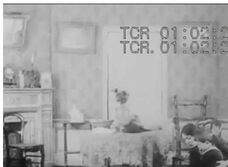
Figura 7: Louise brinca com seu filho. Imagem a princípio tradicional nas representações artísticas do movimento operário no período.