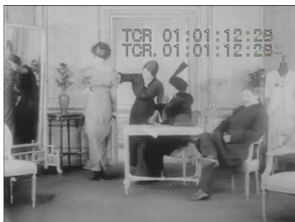
Figura 3: No interior da loja, a dona mostra vestido para clientes burgueses.