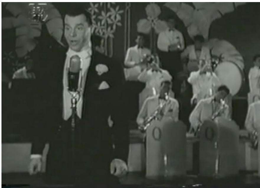
Figura 7. Jorge Goulart canta Mulher do Diabo em É fogo na roupa (1952, Watson Macedo).

Ao cantar Mulher do Diabo , Jorge Goulart faz sua performance mesmo sem pertencer ao grupo de personagens. Não é apresentado pelo mestre de cerimônias que aparece em outras cenas do filme. Surge como cantor famoso e dá o seu recado no palco, onde canta com sua voz projetada, diante da orquestra (Figura 7). O sucesso de Goulart já vinha desde 1949, quando cantou Balzaqueana (uma composição de Nássara e Wilson Batista) no filme Carnaval no Fogo , de Watson Macedo. Em 1950, sua interpretação da marchinha ganharia 2º lugar no concurso de músicas de carnaval da prefeitura do Rio de Janeiro. Em 1950, Goulart lançou Sereia de Copacabana (também de Nássara e Batista, com execução da Orquestra Tabajara de Severino Araújo) para o carnaval, em Aviso aos navegantes , amparado pela gravadora Continental e disputado pela Rádio Tupi e Nacional. Sereia de Copacabana ficou em 3º lugar no concurso de 1951. Esse é um exemplo entre inúmeros, nos quais se verifica a extensa rede de interesses subjacente à escolha dos músicos para participar desses filmes, muito mais determinante do que a necessidade de uma conexão explícita com a trama de É fogo na roupa .