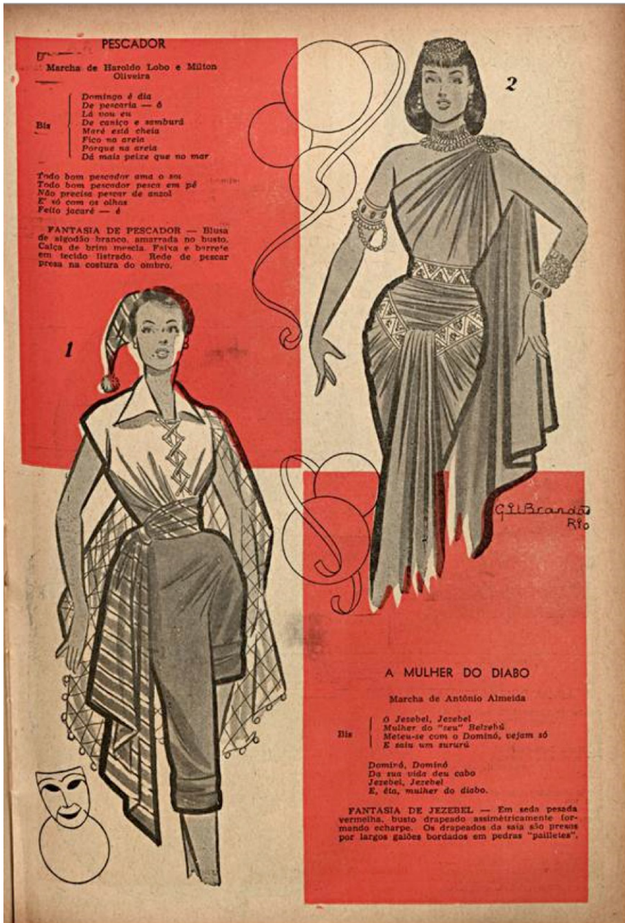
Figura 6: “A mulher do Diabo” na Fon-Fon, 24 de janeiro de 1953, com recomendação de fantasia.