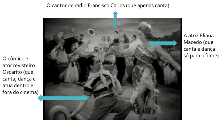
Figura 1: O cantor Francisco Carlos, a atriz de cinema Eliana Macedo e o ator do teatro de revista Oscarito na apoteose “Rio de Janeiro”, em Aviso aos navegantes (1950), de Watson Macedo.

Temos nesse número musical (Figura 1) um cenário com o Pão de Açúcar, similar aos que aparecem nos filmes de Hollywood e também nas revistas teatrais. No fotograma, temos ao fundo o próprio cantor cercado por dançarinos e, em primeiro plano, dois personagens da trama, encarnados pela atriz Eliana Macedo (que se fez dentro do cinema) e o ator cômico Oscarito (um astro do teatro de revista). Vemos claramente os elementos do tripé da cultura de massa dos anos 1940-50, mencionado por Alcir Lenharo: um cantor de rádio que não dança nem atua muito bem, a estrela de cinema que dança e canta (no cinema, mas não no rádio), e o cômico de teatro de revista que faz tudo o que a cena pede, já que esta forma teatral exigia do ator múltiplas capacidades cênicas – cada um deles atua em sua especialidade. A referência visual de Macedo é o cinema, mas nela são introduzidos elementos de outras origens. Ele, sabiamente, insere o cantor de rádio que tem performance pouco dinâmica, numa cena cinemática, mas ele permanece no fundo, para que sejam destacadas as atuações de Oscarito e Eliana. Há dentro do número musical, portanto, a presença de diferentes atuações, diferentes registros ficcionais (a trama e o espetáculo), e os temas e ambientação do carnaval que dá o tom da encenação.