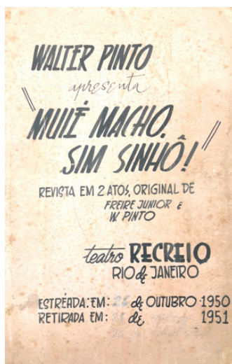
Figura 5: O Teatro Recreio, no Rio de Janeiro, onde a revista Muiê macho, sim sinhô (1950) foi apresentada por cinco meses, e a capa do roteiro da peça submetido à censura.