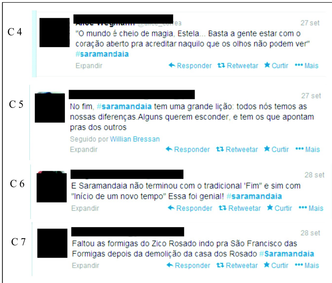
Figura 2: Tweets 4 a 7.