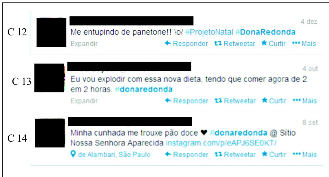
Figura 4: Tweets 12 a 14.

Muitas pessoas acabam utilizando nas conversações expressões construídas por esse laço social que vem da TV. Nos tweets abaixo são exibidas algumas manifestações com o nome Dona Redonda. Nas 45 postagens com a #donaredonda , a grande maioria das pessoas relacionava a personagem ao ato de estar se alimentando fora ou dentro de casa, sozinho ou acompanhado.