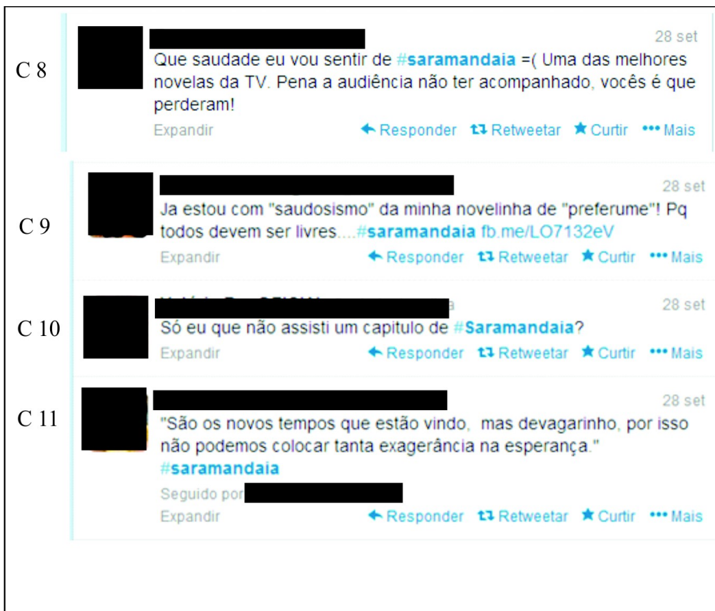
Figura 3: Tweets 8 a 11.