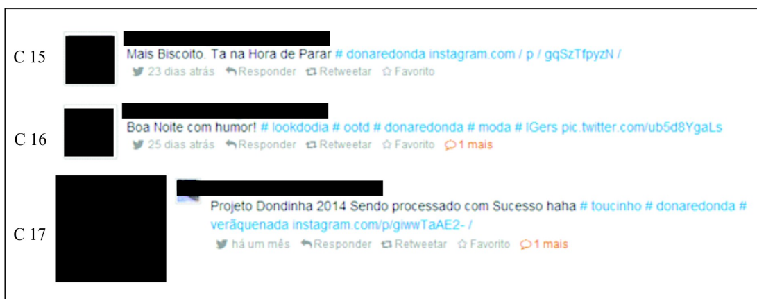
Figura 5: Tweets 15 a 17.