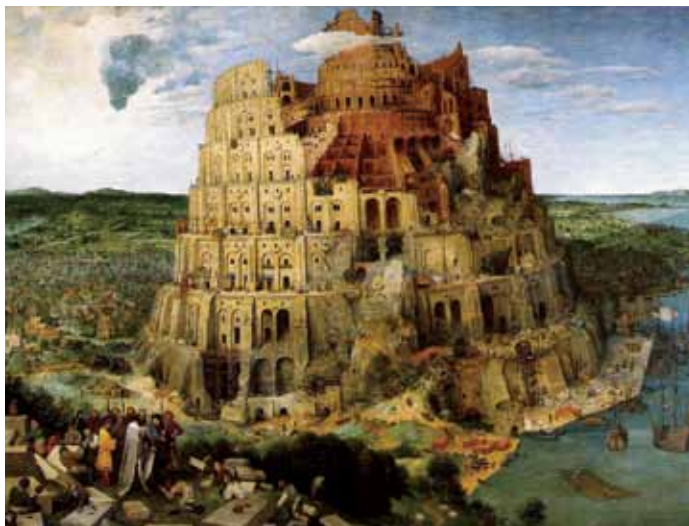
Figura 5. “Torre de Babel”, de Pieter Brueghel, o Velho (1563)