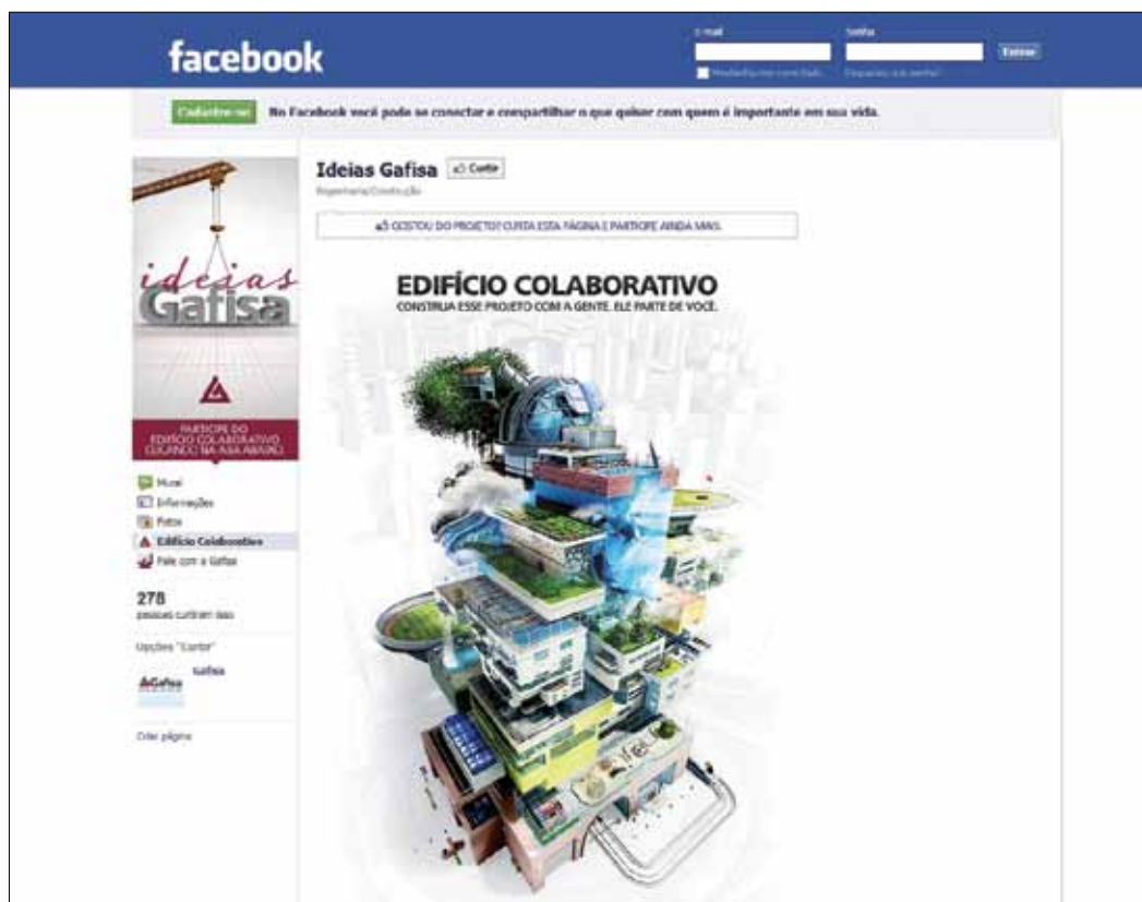
Figura 4. Imagem do endereço do Facebook “Ideias Gafisa”

No entanto, há outra conotação que surge com força a partir da composição estética do projeto imaginado: a simbologia bíblica da torre de Babel (Fig. 5). Uma edificação que simboliza a construção