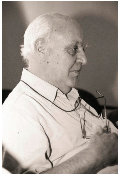
Figura 3: O amigo, set. 2005

Não faltam “emoções” no mundo nosso, mas elas são tantas e a tal ponto banalizadas que acabarão não nos tocando mais. Ao reler esses dois textos, convido o leitor a ficar atento ao que cada um desses autores diz dos “gestos”, do trabalho do “inconsciente” e da “imaginação”, das dimensões – heurística e poética – dos “arquivos da memória” humana.