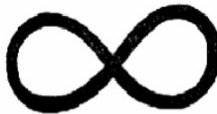
Figura 1. Detalhe de página. Reproduzido de: ROSA, Guimarães. Grande sertão: veredas . 3. ed. Rio de Janeiro: José Olympio, 1964. p. 460.

Cerro. O senhor vê. Conteí tudo. Agora estou aqui, quase barranqueiro. Para a velhice vou, com ordem e trabalho. Sei de mim? Cumpro. O Rio de São Francisco — que de tão grande se comparece — parece é um pau grosso, em pé, enorme... Amável o senhor me ouviu, minha idéia confirmou: que o Diabo não existe. Pois não? O senhor é um homem soberano, circunspecto. Amigos somos. Nonada. O diabo não há! É o que eu digo, se fôr... Existe é homem humano. Travessia.