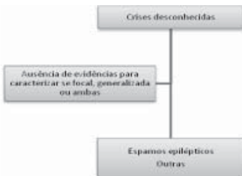
Gráfico 3. Classificação das crises desconhecidas (não classificadas) de acordo com a nova proposta da ILAE, 2010