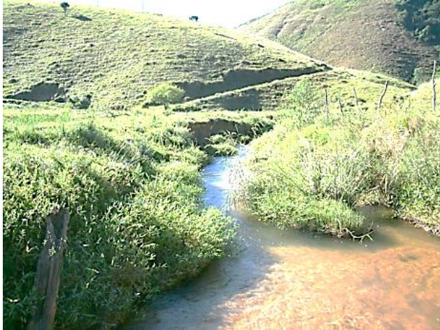
Pt.1 - Rio Grão Mogol, município de Lima Duarte

As bactérias do tipo Salmonellas também foram encontradas em mais da metade das amostras, sendo que em 9 das 15 amostras em que elas estiveram presentes o valor foi acima de 100 UFC/ML. Essas bactérias estão associadas a ocorrência de diversas doenças locais como gastroenterite, septicemia, febre entérica, dentre outras, que acometem a população em contato com a água. Diante disso, os riscos para a população mostram-se preocupantes, uma vez que os hospitais estão distantes das áreas rurais da região.