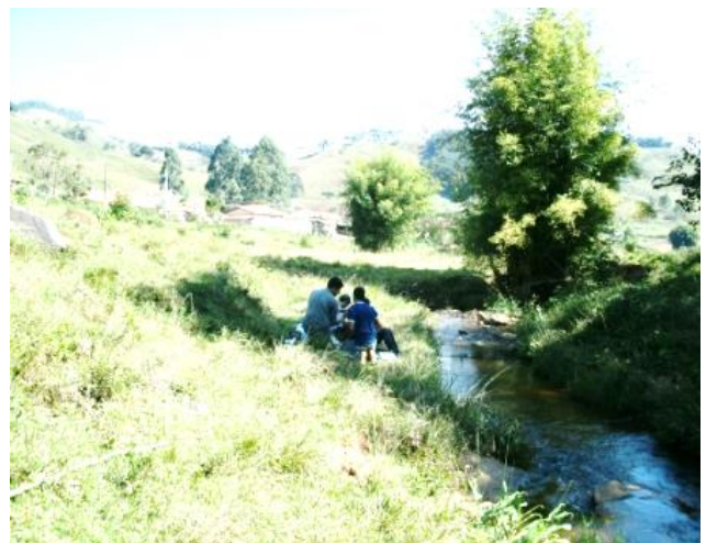
Pt. 7- Córrego Moreiras, Santa Rita do Ibitipoca

Figura 3: Fotografias de alguns pontos de amostragens apresentando a cobertura vegetal do entorno dos rios analisados conduzindo-nos a fazer reflexões sobre a vocação econômica da região e os impactos ambientais associados.