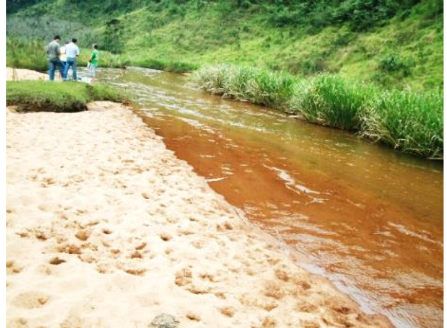
Pt. 5 Rio Grão Mogol, Lima Duarte