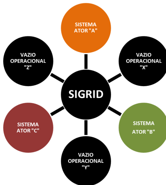
Figura 3: SIGRID como ferramenta de integração entre os atores e sistemas individuais (sistema pião).

O sistema também objetiva suprir os vazios operacionais existentes do ponto de vista de carência de sistemas de informação nos macroprocessos de prevenção, preparação, resposta e reconstrução, além de permitir a extração de padrões de interpretação de informações e da dinâmica de desempenho do Sistema de Proteção e Defesa Civil como um todo, nos moldes dos processos de BI ( Business Intelligence 7 ).