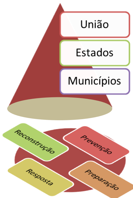
Figura 2: Modelo conceitual cônico da gestão integral de riscos.