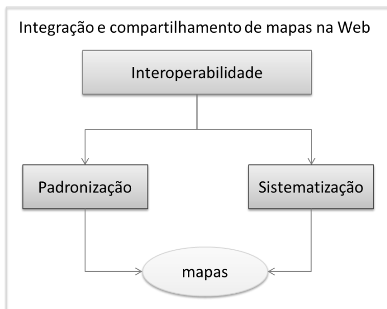
Figura 2: Representação dos processos da interoperabilidade de mapas na Web.

De acordo com Cellarius (1998), a interoperabilidade é a chave para a integração das informações, e deve estar lastreada pelo desenvolvimento de uma infraestrutura de padrões adotados pela comunidade internacional. A interoperabilidade pode ser definida como a capacidade de um sistema ou de seus componentes para compartilhar informações e aplicações, independentemente da sua heterogeneidade (BISHR, 1998). Em decorrência, a interoperabilidade se caracteriza por dois processos distintos: a padronização dos componentes e a sistematização de termos e conceitos, como ilustra a figura 2.